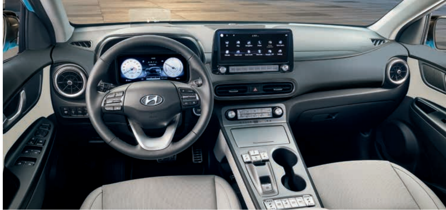
Görseller, Türkiye pazarında satışa sunulan araçlardan farklılık gösterebilir.