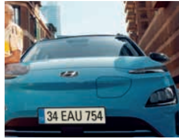
Akıcı aerodinamik tasarım