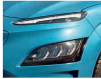
LED ön farlar