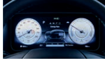
Tamamen dijital 10,25" gösterge bilgi ekranı

Araçta bulunan standart 11 kW dâhili şarj cihazı ile %100 şarj seviyesine yaklaşık 4 saat 20 dakika içerisinde ulaşılabilir. Araç ile birlikte sağlanan ICCB kablo ve standart ev tipi 230 V elektrik prizi ile 17 saatte tam şarja ulaşılabilir. (39,2 kWh batarya için geçerli değerlerdir.)