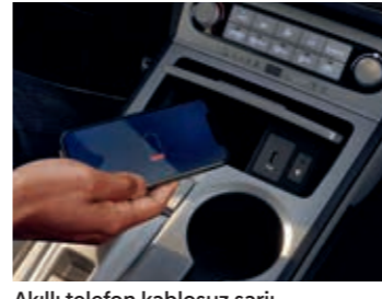
Akıllı telefon kablosuz şarjı

Geleceği yaşamaya bugünden başlamak istiyorsan, fırsatını bulduğunda ona doğru bir adım atmalısın. KONA Elektrik, sana bu fırsatı sunmak için doğdu. 484 km'lik sürüş menzili, elektronik vites paneli, 10,25" dokunmatik bilgi eğlence sistemi, KRELL Premium ses sistemi ve daha birçok son teknoloji özelliğiyle, seni bugünün ötesine taşımaya geldi.