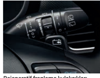
Rejeneratif frenleme kulakçıkları