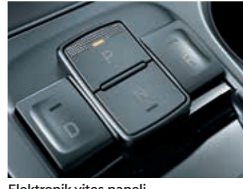
Elektronik vites paneli