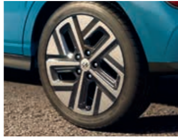
17 inç alaşım jant