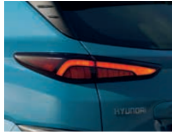
LED arka lamba grubu