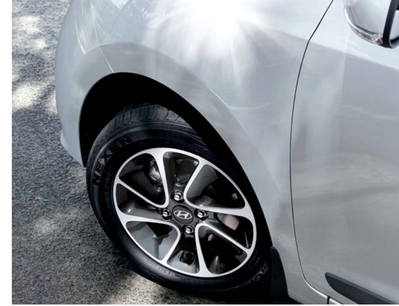
1. سبائك دو اليب أنيقة