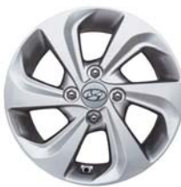
عجلات ألومنيوم 14" (لون فضي نظيف)