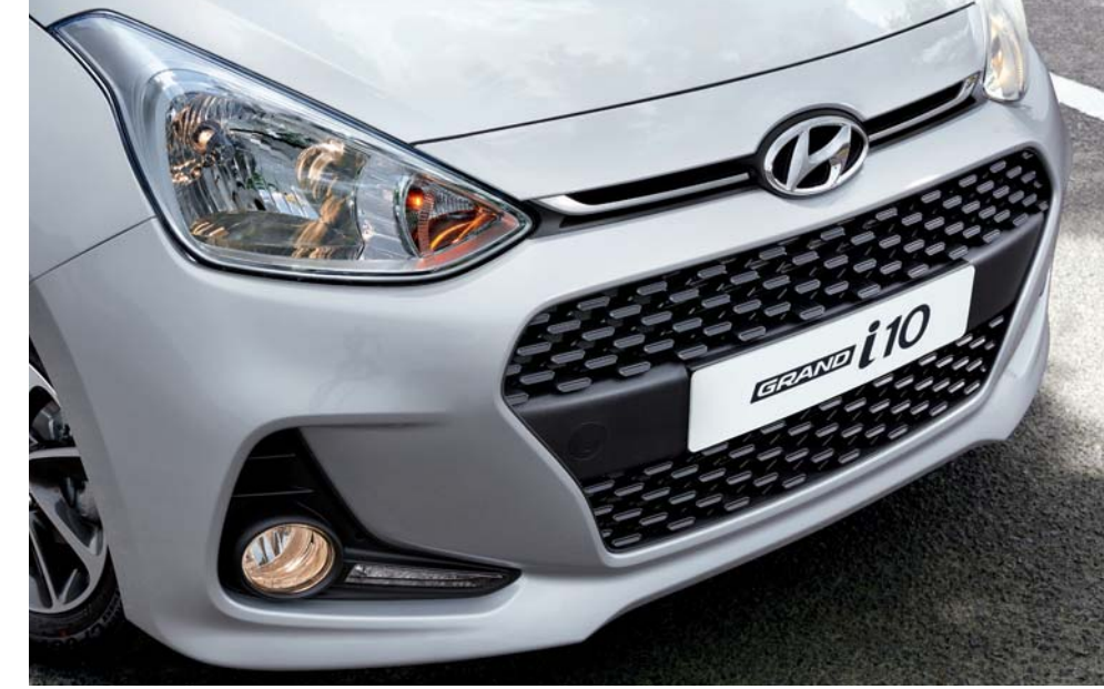
2. كشافات أمامية كبيرة تحيط بالزاوية