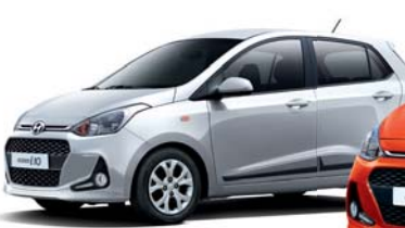
1.25 / 1.0 GL