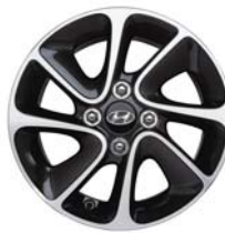
عجلات ألومنيوم 14" (بدرجتين من اللون مختلفتين)