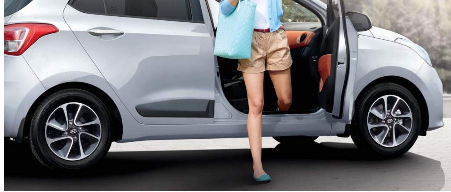
3. عتبة أقل ارتفاعا