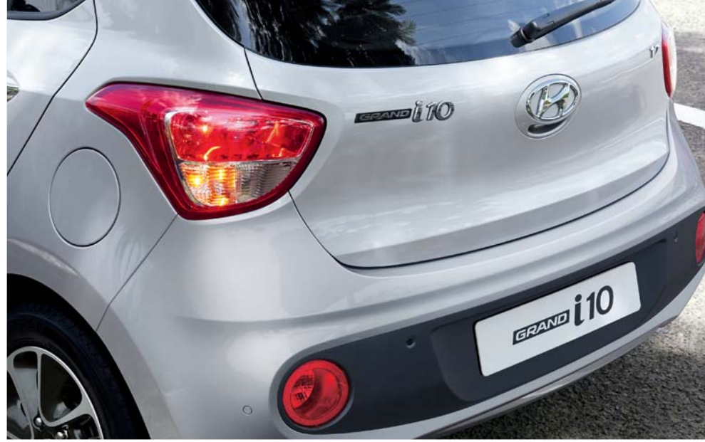
4. مصابيح خلفية كبيرة تحيط بالزاوية

تأتي البداية في المقدمة المزودة بكشافين أماميين شفافين يحيط بزائيتها، بهما عاكسات متعددة البؤر تتلاقى مع لمبات إل إي دي النهارية لتعطي إضاءة قوية. أما الخلف فيظهر تطورا حضريا حقيقيا: مصابيح خلفية ثنائية ذات حجم كبير، ترفع مستوى الرؤية إلى الحد الأقصى بينما توارى علامة "H"، المطلية بالكروم، قفل الباب الخلفي وكاميرا الرؤية الخلفية الاختيارية بمهارة.