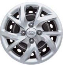
غطاء عجلات فولاذي 14"