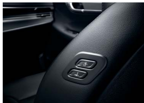
동승석 워크인 스위치