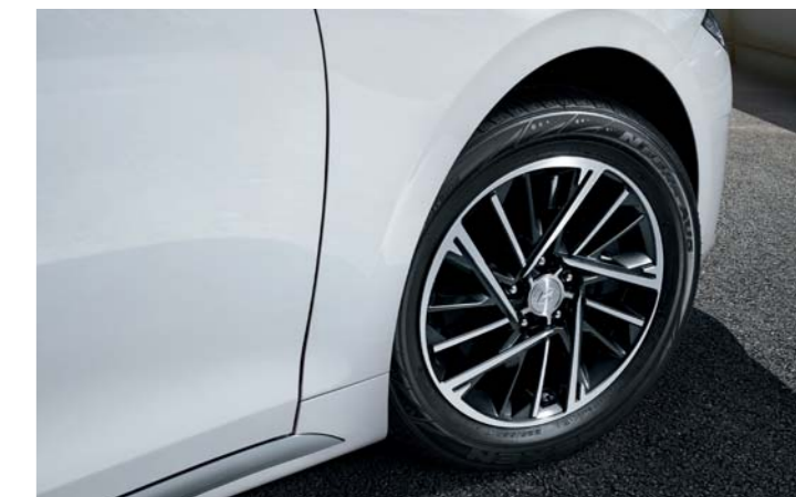
LED 리어 콤비램프 (제동등, 후미등 적용) 17인치 알로이 휠