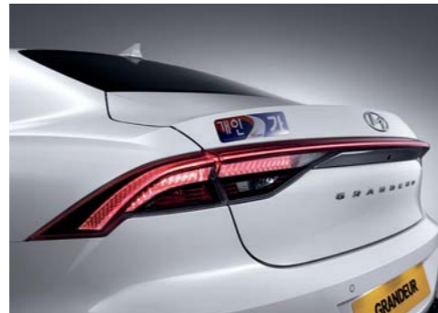
LED 리어 콤비램프 (제동등, 후미등 적용) 듀얼 풀오도 에어컨 (공기 청정 시스템 포함)