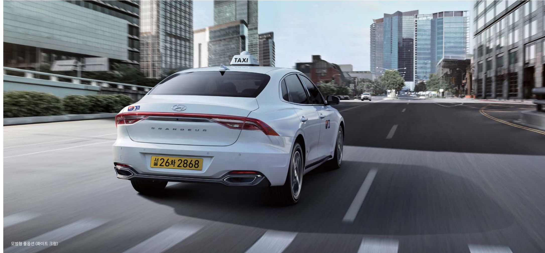
모범형 풀옵션 (화이트 크림)

탑승자와 보행자의 안전까지 배려하는 다양한 안전사양들이 운전자의 쾌적한 드라이빙을 도와줍니다.