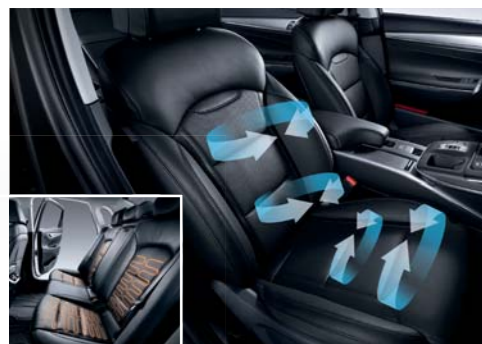
동승석 통풍시트 / 뒷좌석 열선시트