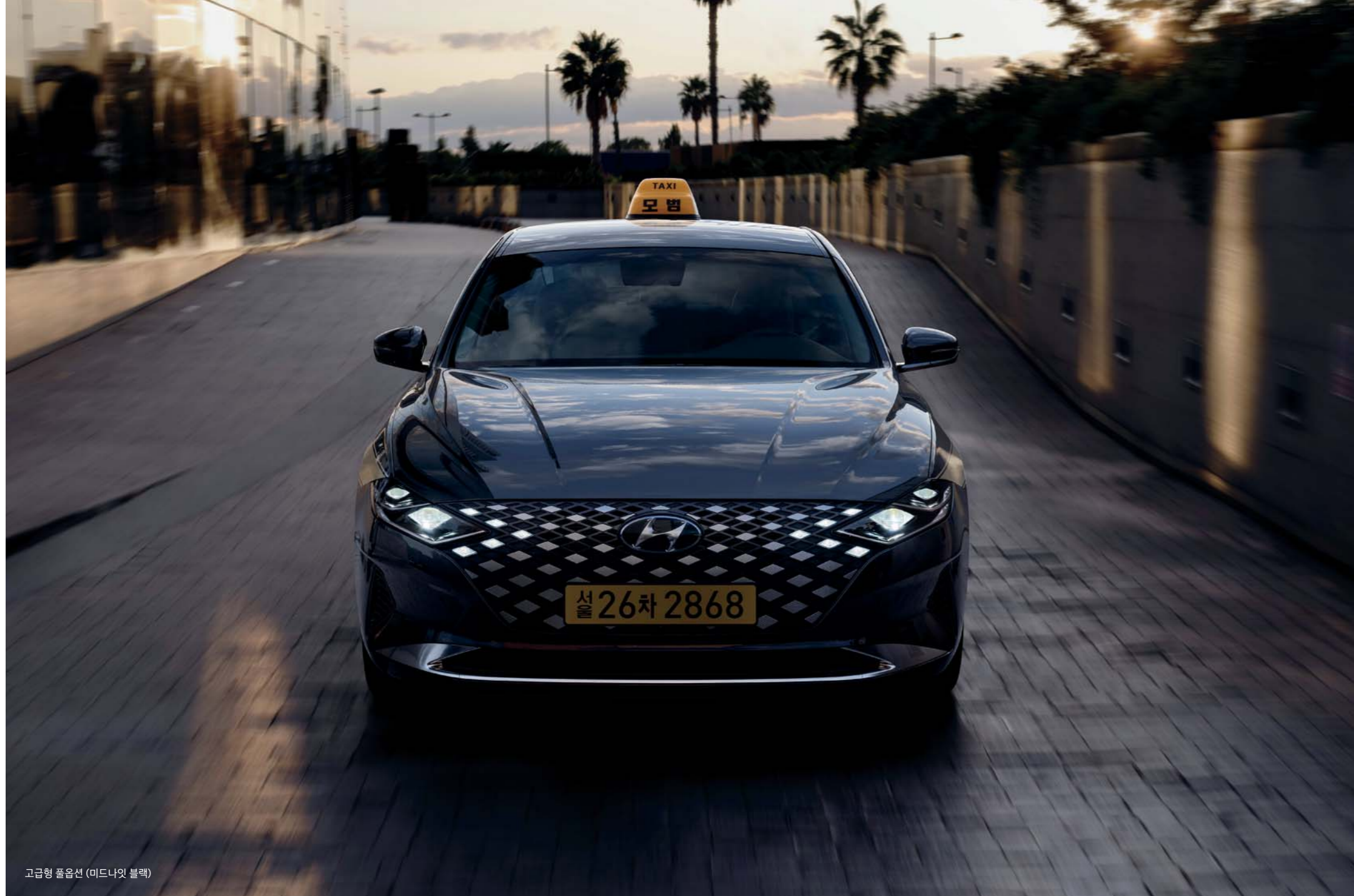
고급형 풀옵션 (미드나잇 블랙)