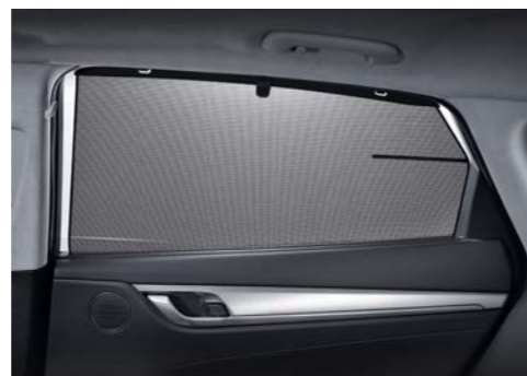
뒷좌석 수동식 도어 커튼