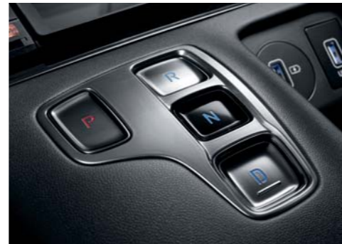
전자식 변속버튼 원형 봄베