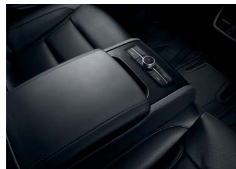
뒷좌석 고급형 암레스트 (스키스루, 오디오 컨트롤)