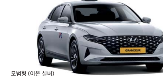
모범형 (이온 실버)