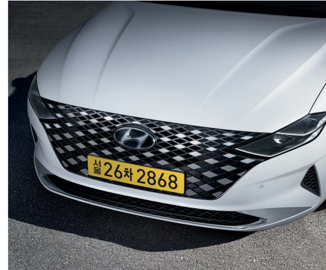
Full LED 헤드램프 / 반광 크롬 라디에이터 그릴

미래지향적인 전면부는 '센슈어스 스포티니스' 디자인 방향성을 적용하였으며 매끄럽고 스포티한 측면부터 와이드한 리어램프로 이어진 후면까지, 새로운 디자인 비전을 담았습니다.