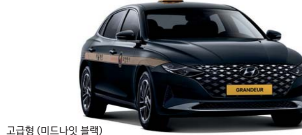
고급형 (미드나잇 블랙)