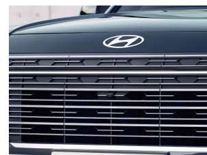
ກະຈັງໜ້າ Dark chrome radiator grille