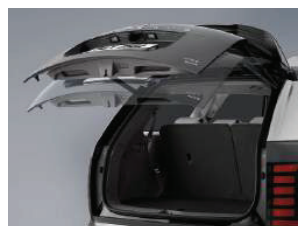
ລະບົບປະຕູຫ້າຍອັດສະລິຍະ Smart Power Tailgate