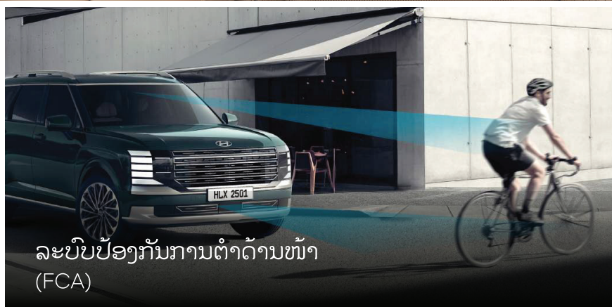
ລະບົບປ້ອງກັນການຕໍ່າດ້ານໜ້າ (FCA)