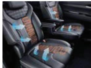
ເບາະນັ່ງລະບາຍອາດ Ventilated & heated 1st & 2nd seats