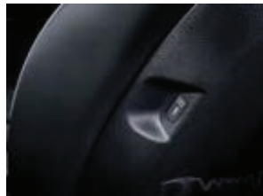
ຊ່ອງຫົວສາກ USB-C USB charging ports