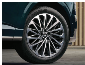
ລໍ່ແມັກ 21ນິ້ວ 21-inch Alloy Wheels