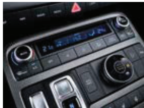
ລະບົບປັດອາກາດອັດຕະໂນມັດ Full auto air conditioning