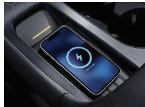
ສາກໂທລະສັບແບບໄຮ້ສາຍ Wireless smartphone charger