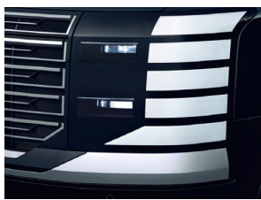
ຕາໄຟໜ້າ LED LED DRL & Positioning Lamps Full LED Headlamps (Projection Type)