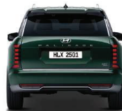
Wheel tread (21" Wheel) 1,723