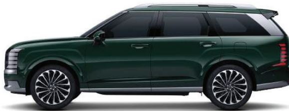
Wheelbase 2,970 Overall length* 5,060