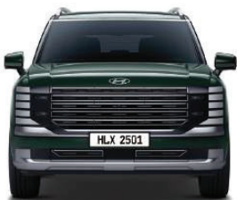
Wheel tread (21" Wheel) 1,711 Overall width 1,980