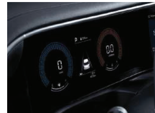
ແຜງໜ້າປັດຂະໜາດ 4.2ນິ້ວ 4.2" TFT LCD