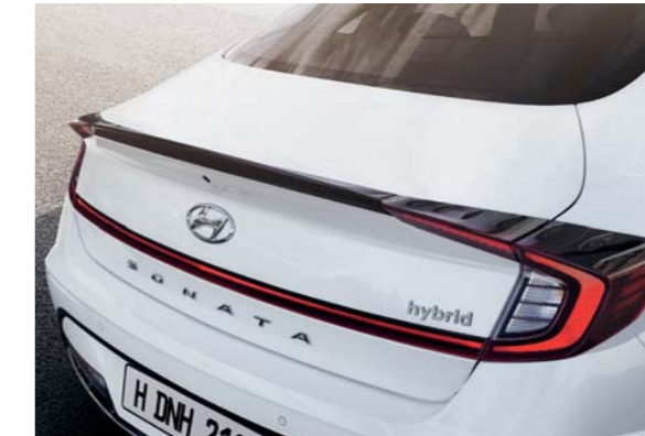
مجموعة مصابيح خلفية LED ومصد خلفي مدمج

تبدو تصميمات العجلات الهجينة عصرية وقادرة على أن تقلل أيضاً من سحب الرياح والتحسين من كفاءة استهلاك الوقود بمساعدة اختيار أنفاق الرياح الهوائية، تم تزويد السيارة بعجلات مقاس 16 بوصة قياسية من جودير Touring Eagle، بينما تتوفر اختياريًا عجلات مقاس 17 بوصة من Pirelli P-Zero متألية لجميع الفصول.