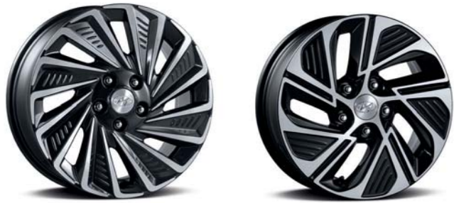
عجلات معدنية 17 بوصة