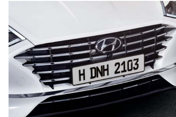
شبكة أمامي متقاطع مع ألواح تهوية نشطة

تُبرز مجموعة المصابيح الخلفية LED جمال وأناقة الإضاءة فيها، وتوفر الحد الأقصى من الرؤية من خلال امتدادها على العمق الإجمالي للصندوق الخلفي، بينما تحقق حافة غطاء الصندوق الديناميكية الهوائية المثلى من خلال دمج المصد وسلسلة موازية من الانحناءات.