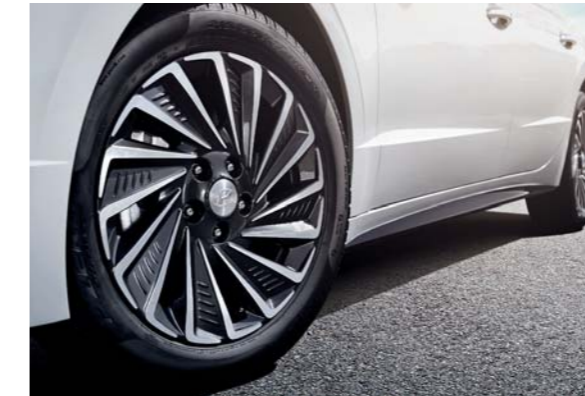
عجلات معدنية مقاس 17 بوصة محسنة ديناميكياً

تبدو تصميمات العجلات الهجينة عصرية وقادرة على أن تقلل أيضاً من سحب الرياح والتحسين من كفاءة استهلاك الوقود بمساعدة اختيار أنفاق الرياح الهوائية، تم تزويد السيارة بعجلات مقاس 16 بوصة قياسية من جودير Touring Eagle، بينما تتوفر اختياريًا عجلات مقاس 17 بوصة من Pirelli P-Zero متألية لجميع الفصول.