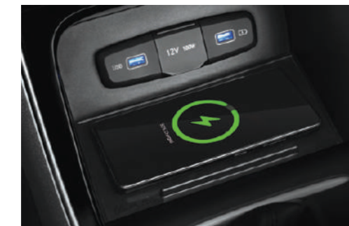
Wireless Charger พร้อมสำหรับชีวิตสมารถในทุกด้าน ไม่พลาดทุกการติดต่อ ด้วยที่ชาร์จโทรศัพท์แบบไร้สาย