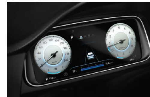
10.25" Full LCD Cluster แผงหน้าปัด Full LCD Cluster ขนาด 10.25 นิ้ว ปรับได้ 4 รูป แบบตามระบบการขับขี่ สามารถเลือกสไตล์ได้ตามโหมดการขับขี่