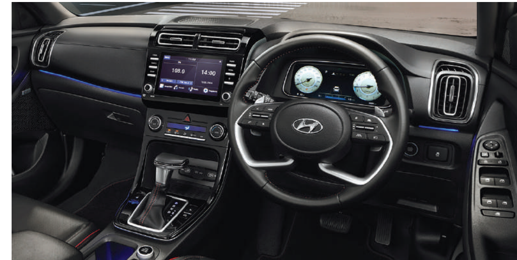
รองรับไลฟ์สไตล์ด้วยระบบเอนเตอร์เทนเมนต์ และเทคโนโลยีที่พร้อมคอนเนกต์ทุกด้านของชีวิตได้อย่างลงตัว