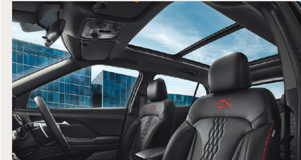
Panoramic Sunroof ช่วยให้อากาศโปร่งสบาย โปร่งสบาย (เฉพาะรุ่น Style Plus และ Alpha)