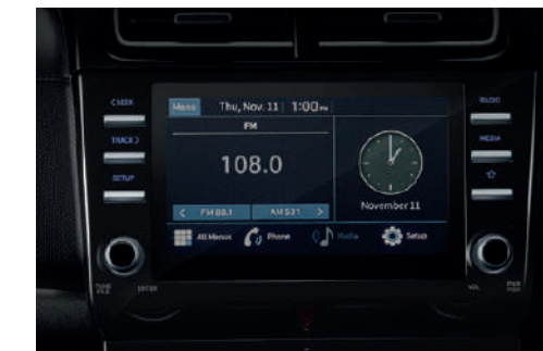
Smart Entertainment หน้าจอทัชสกรีนขนาด 8 นิ้ว รองรับ Apple CarPlay และ Android Auto ควบคุมด้วยปุ่มฟังก์ชันที่ใช้งานง่ายขั้น