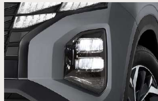
LED Headlights ไฟหน้า LED แบบมัลติรีเฟลคเตอร์ สว่างชัดทุกเส้นทาง