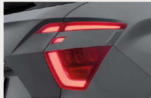
LED Tail Lights ไฟท้าย LED ที่ได้รับแรงบันดาลใจจากบูมเมอแรง