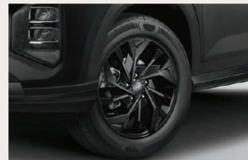
17" Diamond Cut Alloy Wheels ล้ออัลลอยแบบ Diamond Cut ขนาด 17 นิ้ว