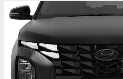
Parametric Jewel Radiator Grille กระจังหน้าดีไซน์ล้ำ ลुकพรีเมียม ดึงดูดทุกสายตา