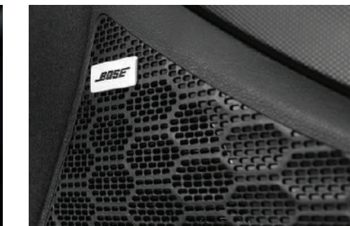
BOSE™ premium audio system ระบบเครื่องเสียงระดับพรีเมียม BOSE พร้อมระบบเสียง 3 มิติ (เฉพาะรุ่น Alpha)