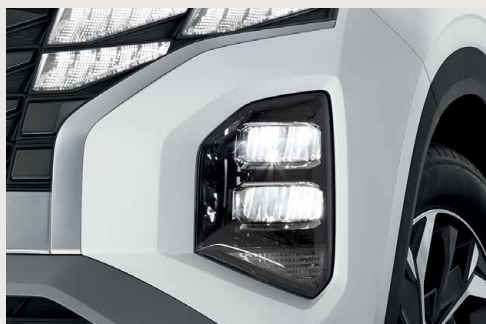
LED Headlights ไฟหน้า LED แบบมัลติรีฟเลกเตอร์ สว่างชัดทุกเส้นทาง

ดีไซน์ล้ำสมัย สะดุดทุกสายตา พร้อมประสิทธิภาพเหนือชั้น ขับเคลื่อนด้วยสมรรถนะอันทรงพลัง ด้วยฟังก์ชันการใช้งานที่ครบครัน มอบประสบการณ์เหนือระดับที่ทำให้คุณหลง