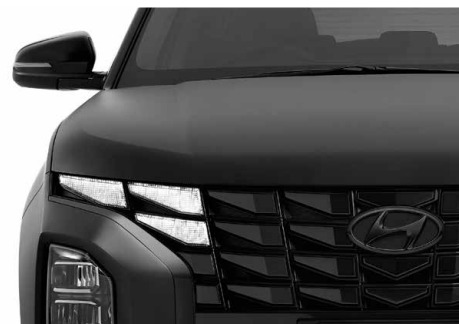
Parametric Jewel Radiator Grille กระจังหน้าดีไซน์ล้ำ ลุกพริบเมี่ยม ดึงดูดทุกสายตา