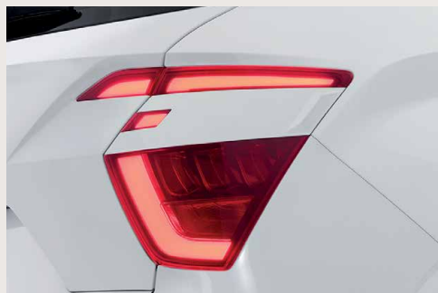
LED Tail Lights ไฟท้าย LED ที่ได้รับแรงบันดาลใจจากบูมเมอแรง