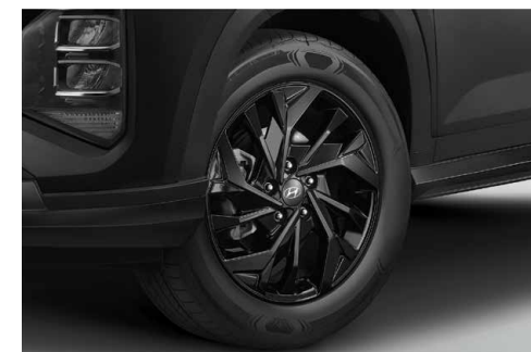
17" Diamond Cut Alloy Wheels ล้ออัลลอยแบบ Diamond Cut ขนาด 17 นิ้ว