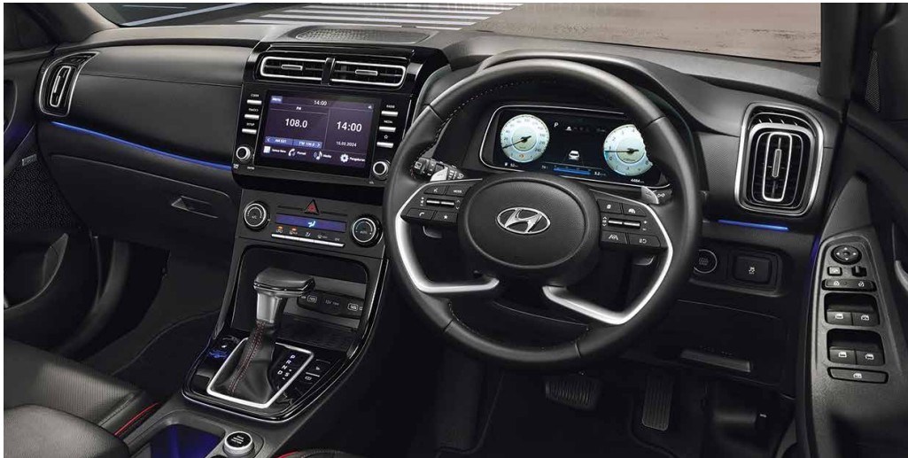
รองรับไลฟ์สไตล์ด้วยระบบเอนเตอร์เทนเมนต์ และเทคโนโลยีที่พร้อมคอนเนกต์กับทุกด้านของชีวิตได้อย่างลงตัว