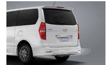
Back Sensor เซ็นเซอร์ระยะ: เพิ่มความมั่นใจเมื่อต้องจอดรถในพื้นที่จำกัด