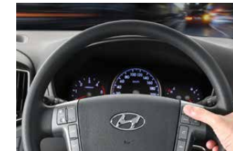
Cruise Control ระบบควบคุมความเร็วอัตโนมัติ