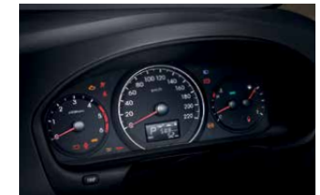
Supervision Meters แสงขาวบนพื้นค่า แสดงข้อมูลการเดินทางแบบดิจิทัล