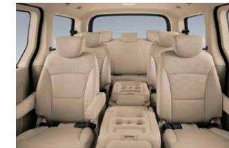
Flexible Seating Configuration รองรับได้ถึง 11 ที่นั่ง ปรับเลือกตำแหน่งที่นั่งได้หลากหลาย