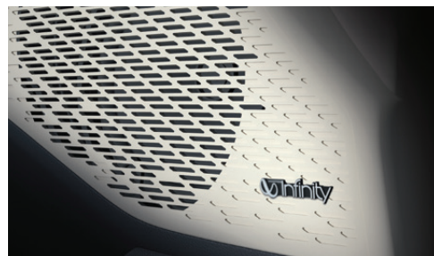
Infiniti Premium Sound System ระบบเครื่องเสียง Infiniti Premium Sound System 12 จุด พร้อมยกระดับความพรีเมียมในทุกเส้นทางของคุณ