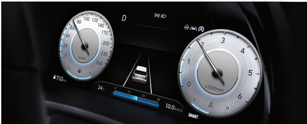
12.3" Supervision Color TFT LCD Meter Cluster หน้าจอแสดงผลการขับขี่ความละเอียดสูงแบบ LCD 12.3 นิ้ว

ก้าวเข้าสู่โลกแห่งความผ่อนคลายที่เหนือระดับ ผ่านการออกแบบที่เรียบหรู ประณีต ใส่ใจทุกรายละเอียด และฟังก์ชันที่ตอบโจทย์ครบครัน พร้อมสร้างช่วงเวลาแห่งความสุขในทุกการเดินทาง