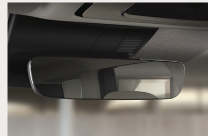
Frameless Electrochromatic Mirror กระจกมองหลังแบบไร้ขอบ พร้อมระบบตัดแสงอัตโนมัติ