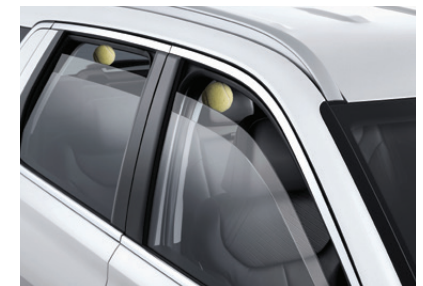
Power Window with Anti Pitch

กระจกมองข้างดีไซน์เอกลักษณ์ มาพร้อมกับไฟ LED เพื่อส่งสัญญาณการเลี้ยว