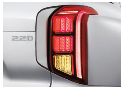
LED Rear Combination Lamp

กระจังหน้าสีดำและโลโก้แบบ Dark Metallic Chrome