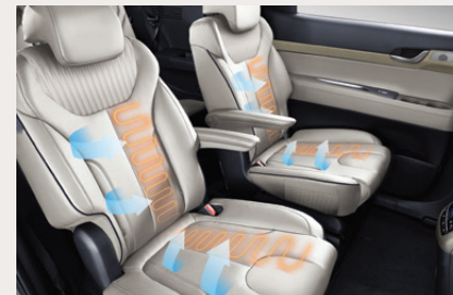
Heated & Ventilated Seats เบาะคู่หน้าแบบ Captain Seat พร้อมระบบทำความร้อนและเย็น เสริมความสะดวกด้วยระบบ One Touch Walk-in System