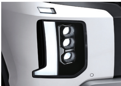
LED DRL + Full LED Headlamps (Hi/Low)

*รุ่นที่จัดจำหน่ายในประเทศไทยจะมาพร้อมระบบขับเคลื่อน 2 Wheel Drive และ 4 Wheel Drive