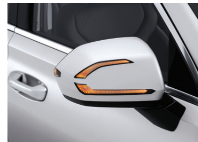
Outside Mirror with LED Turn Signal

กระจกมองข้างดีไซน์เอกลักษณ์ มาพร้อมกับไฟ LED เพื่อส่งสัญญาณการเลี้ยว