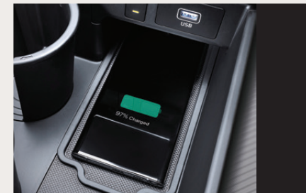
Wireless Smartphone Charger แท่นชาร์จโทรศัพท์แบบไร้สายให้ทุกการเดินทางไม่มีสะดุด