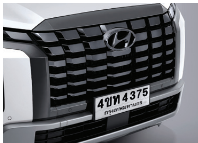
Premium Parametric Shield

ไฟหน้าแบบ Full LED มีระดับการปรับแบบสูงต่ำ พร้อมด้วยไฟส่องสว่างตอนกลางวัน