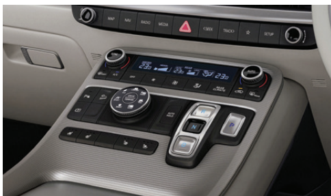
Bride-type High Console คอนโซลหน้ารถแบบ Bride-type High Console มาพร้อมความสะดวกสบายและเรียบหรูที่ออกแบบรองรับในทุกการเดินทาง