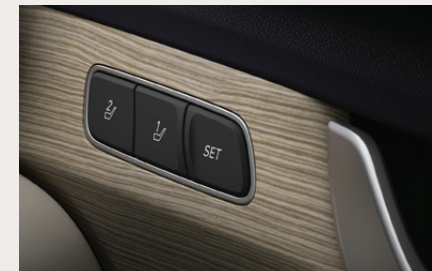
Integrated Memory System (driver) ระบบบันทึกตำแหน่งที่นั่งผู้ขับขี่ (2ตำแหน่ง) ให้ทุกการขับขี่สะดวกกว่าที่เคย