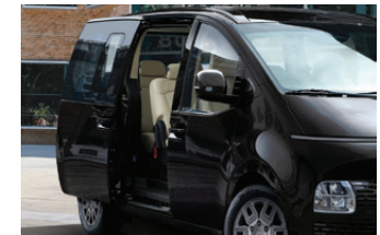
Smart Power Sliding Doors

ระบบเปลี่ยนเกียร์แบบปุ่มกด Shift-by-wire