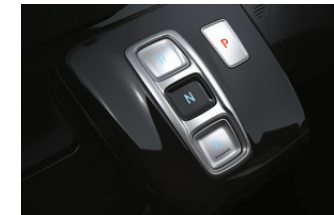
Electronic Gear Shift Button

รองรับ Apple CarPlay และ Android Auto แบบไร้สาย