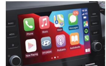
Apple CarPlay / Android Auto

หน้าจอแสดงผลการจับที่ความละเอียดสูงแบบ LCD 10.25 นิ้ว