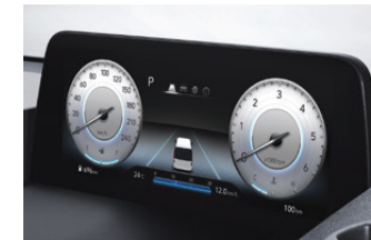
10.25" Full LCD Cluster

รองรับได้ถึง 11 ที่นั่ง ปรับเลื่อนตำแหน่งที่นั่งได้หลากหลาย