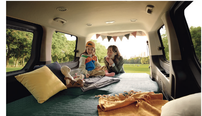
Flexible Seating Configuration

รองรับได้ถึง 11 ที่นั่ง ปรับเลื่อนตำแหน่งที่นั่งได้หลากหลาย