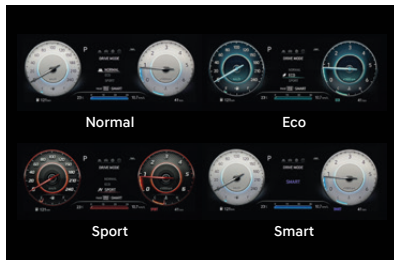
Drive Mode Selection

ปรับสปีดด้วย 4 โหมดการขับที่ตอบสนองได้ตั้งใจ เลือกเปลี่ยนได้ตามอารมณ์ที่แตกต่าง