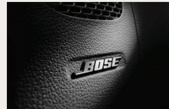
BOSE Premium Sound System ระบบเครื่องเสียงพรีเมียมจาก BOSE เพื่อรรถรสในการฟังเพลง

ที่สุดแห่งความสนุกก็ไปกับความพรีเมียม ไม่ว่าจะเป็นเรื่องของวัสดุหรือฟังก์ชันการใช้งาน และระบบต่างๆ ที่พร้อมตอบโจทยให้การเดินทางของคุณพิเศษกว่าที่เคย