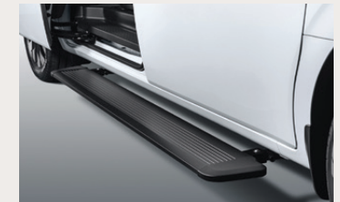
Power Side Step บันไดข้างไฟฟ้าช่วยให้การขึ้นหรือลงรถสะดวกสบายยิ่งขึ้น