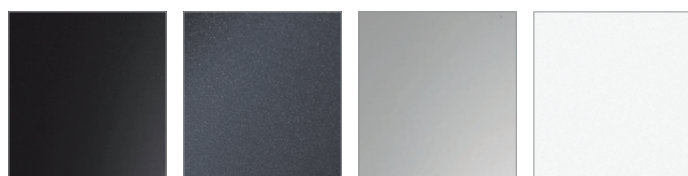
Abyss Black Pearl Graphite Gray Metallic Shimmering Silver Metallic Creamy White™