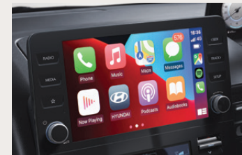
Apple CarPlay / Android Auto รองรับทุกการเชื่อมต่อไม่ว่าจะเป็น Apple CarPlay หรือ Android Auto