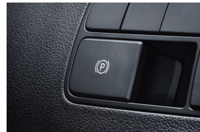
Electronic Parking Brake (EPB) with Auto Hold

ควบคุมการขับที่ได้ตั้งใจด้วยเป็นเปลี่ยนเกียร์ที่ พวงมาลัย เลือกเพิ่มและลดเกียร์ได้สะดวกสบาย