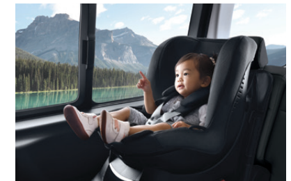
Child Seat Anchor (ISOFIX)

ระบบช่วงล่างตอนหลังแบบ Multi-link ให้การขับที่เป็นไปอย่างนุ่มนวลยิ่งกว่าที่เคย