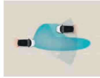
Gelişmiş Aktif Güvenlik özellikleri