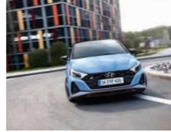
M-LSD Mekanik Sınırlı Kaydırmalı Diferansiyel

Diferansiyel kilidi keskin virajlarda bile mümkün olan en iyi kavrama için ön tekerleklere güç aktarımının mekanik olarak kontrol edilmesini sağlar.