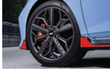
18 inç performans lastikleri ve kırmızı fren kaliperleri