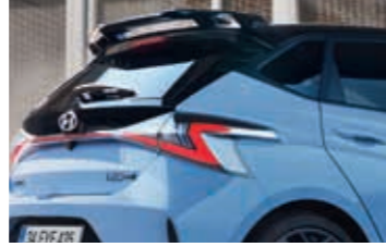
WRC'den ilham alan arka spoyler