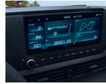
Performans Sürüş Veri Sistemi