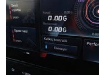
Kalkış Kontrol Sistemi (Launch Control)

Değişken susturucu kontrolü, mükemmel egzoz sesini oluşturmanıza olanak tanır.