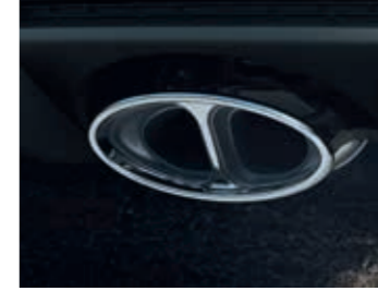
Spor Egzoz Sistemi

Direksiyon simidindeki kırmızı düğme ile etkinleştirilen devir eşleştirme sistemi, vites küçültürken motor devrini otomatik olarak artırır, optimum vites değişiklikleriyle sportif vites değişimini sağlar.