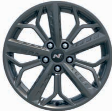
18 inç alaşım jant