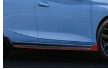
Kırmızı dekorlu yan marşpiyel