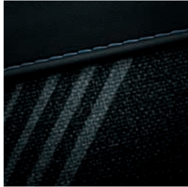
Siyah iç mekân ve siyah tavan döşemesi