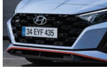
N logolu ve yarış bayrağı desenli sportif ön ızgara