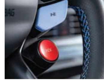
Rev Matching - Devir Eşleştirme Sistemi

Diferansiyel kilidi keskin virajlarda bile mümkün olan en iyi kavrama için ön tekerleklere güç aktarımının mekanik olarak kontrol edilmesini sağlar.