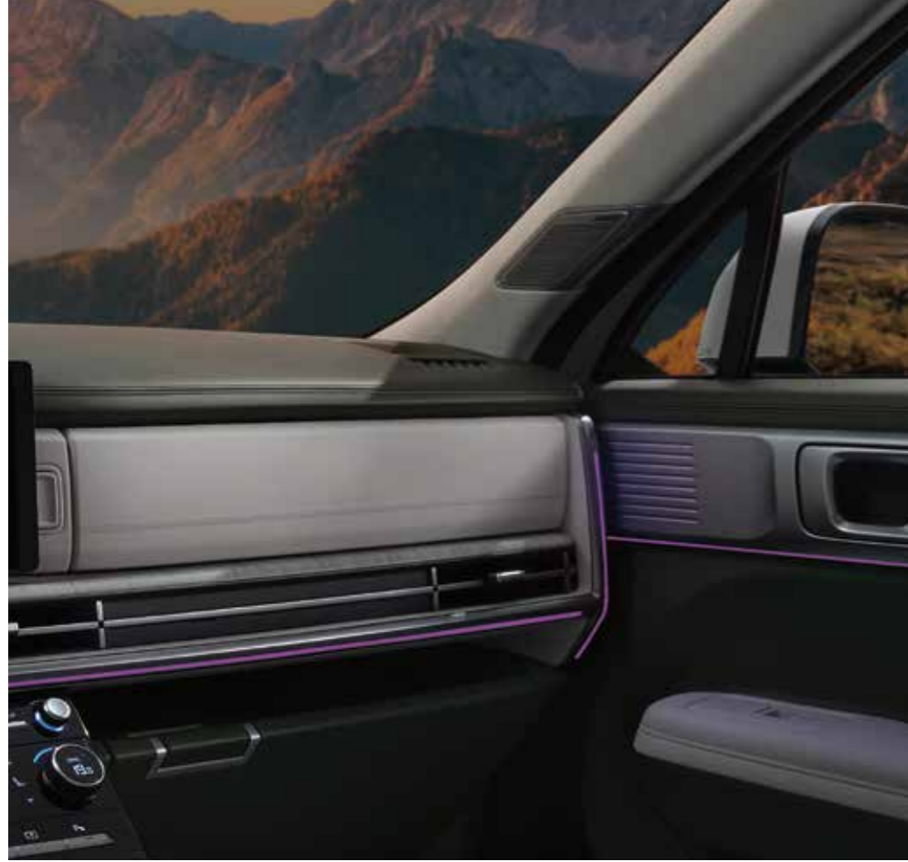
Ambiyans aydınlatması (64 renk)

Huzurlu ve rahat bir ortam oluşturmak için dengeli bir tasarıma sahip iç mekân, olağanüstü bir konfor sunuyor.