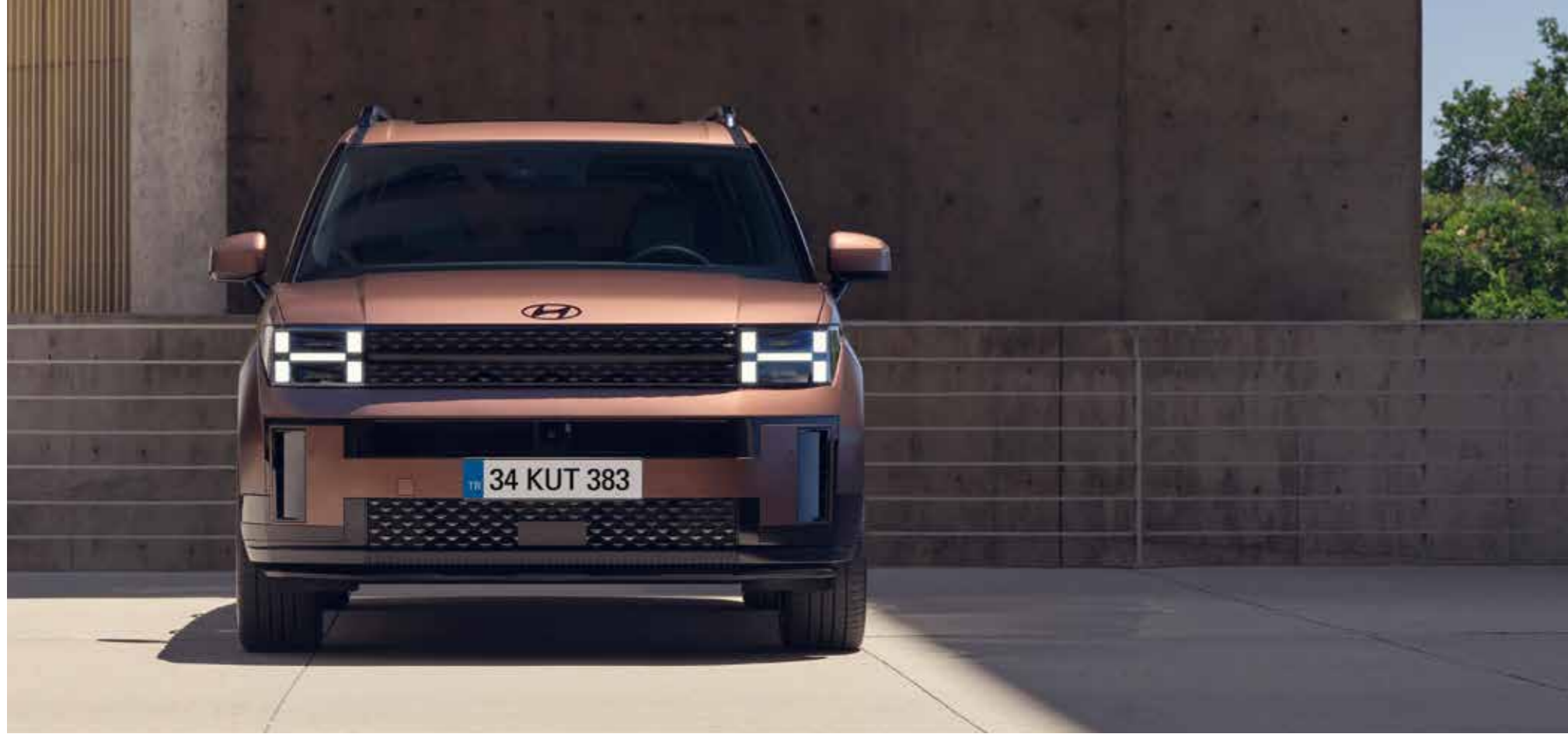
H-İmzalı projeksiyon tipi LED ön farlar

Her açıdan şık ve güçlü görünümüyle SANTA FE, dikkat çekici “H-İmzalı” formunda aydınlatmalara sahip. Bu aydınlatmalar, cesurca şekillendirilen kusursuz gövdeye benzersiz bir dokunuş katıyor.