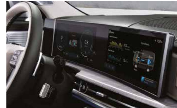
Direksiyondan kumandalı vites kulakçıkları