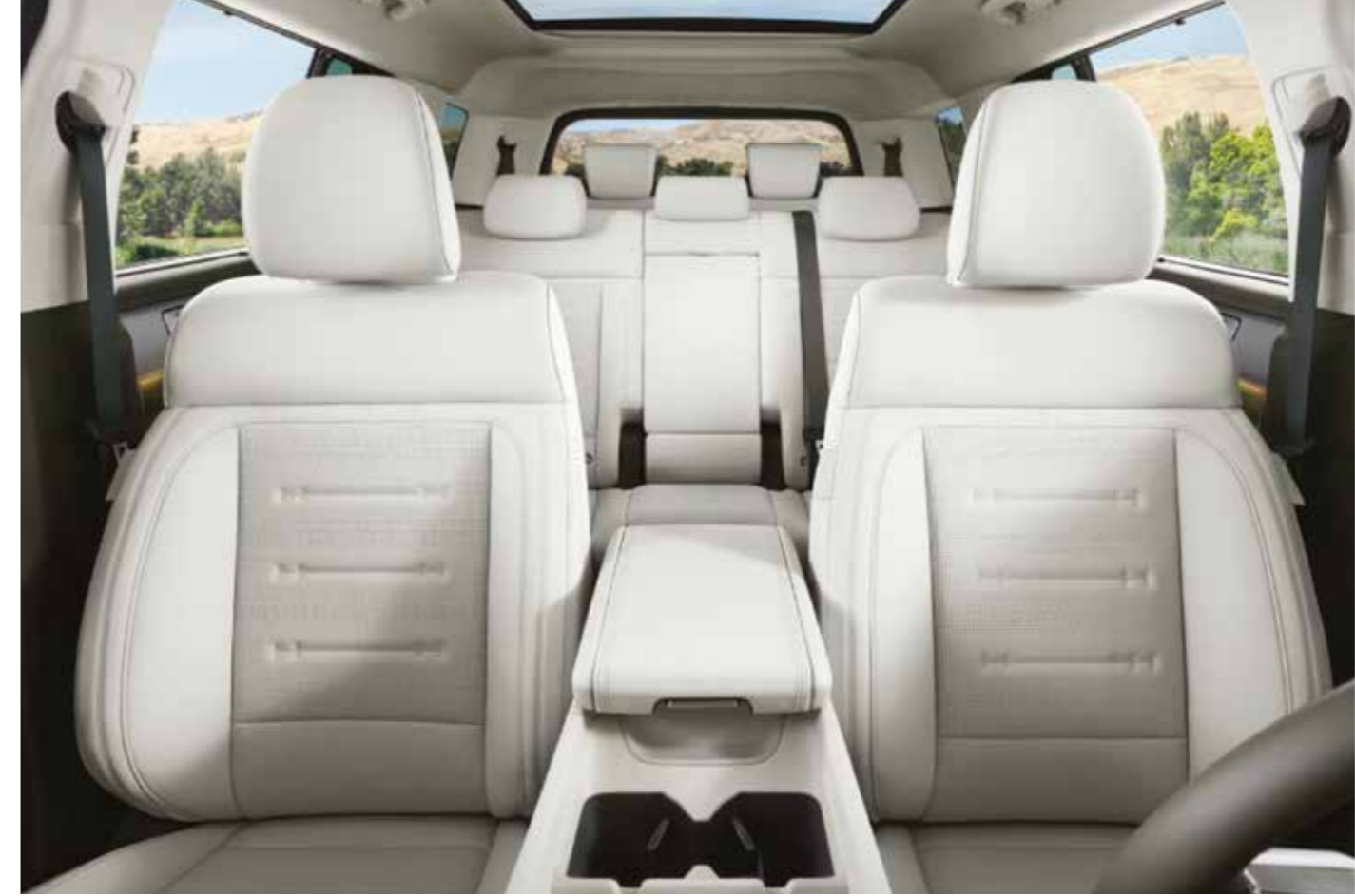
Deri, 7 koltuklu

SANTA FE, 7 koltuklu geniş araç içiyle büyük konfor sunuyor, hep daha fazlasına olanak tanıyor.