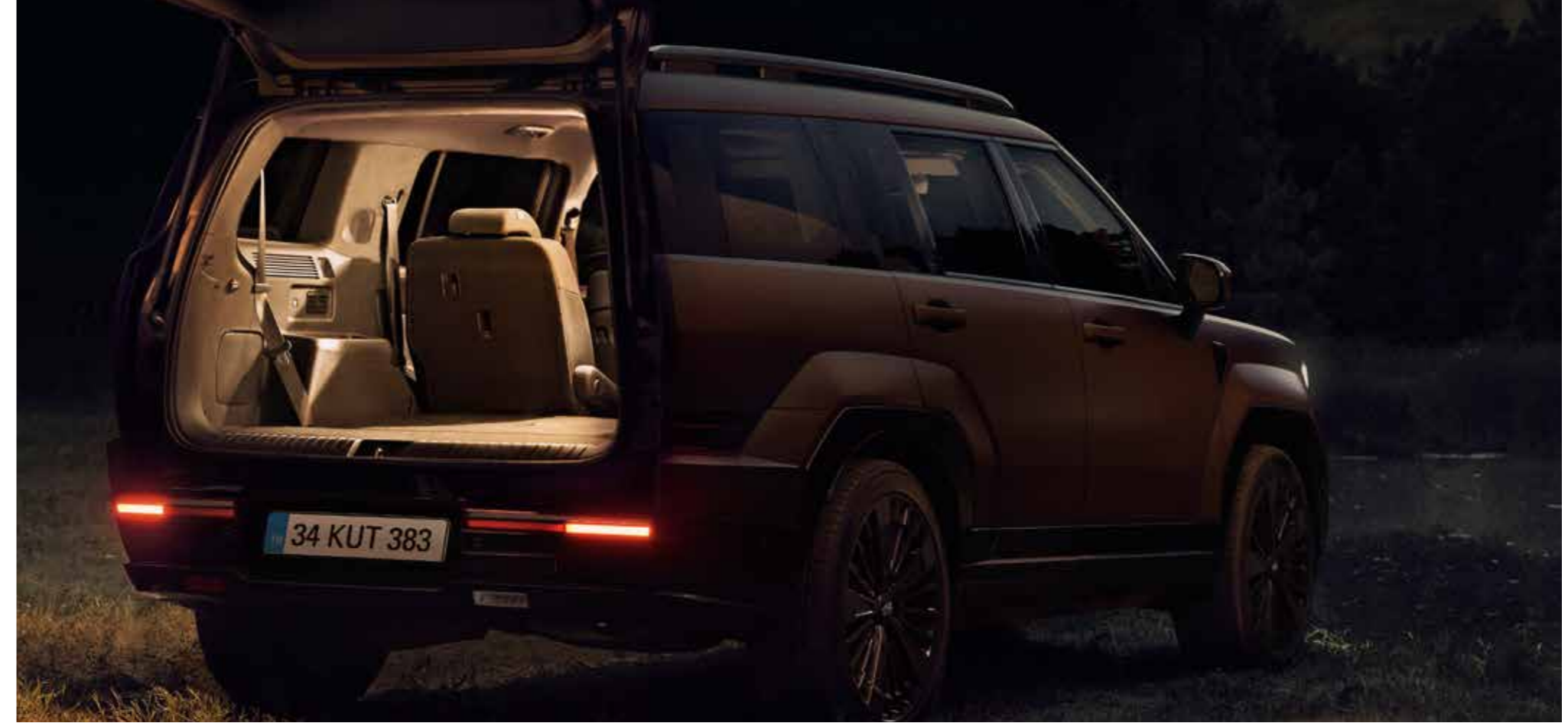
LED arka lamba kombinasyonu