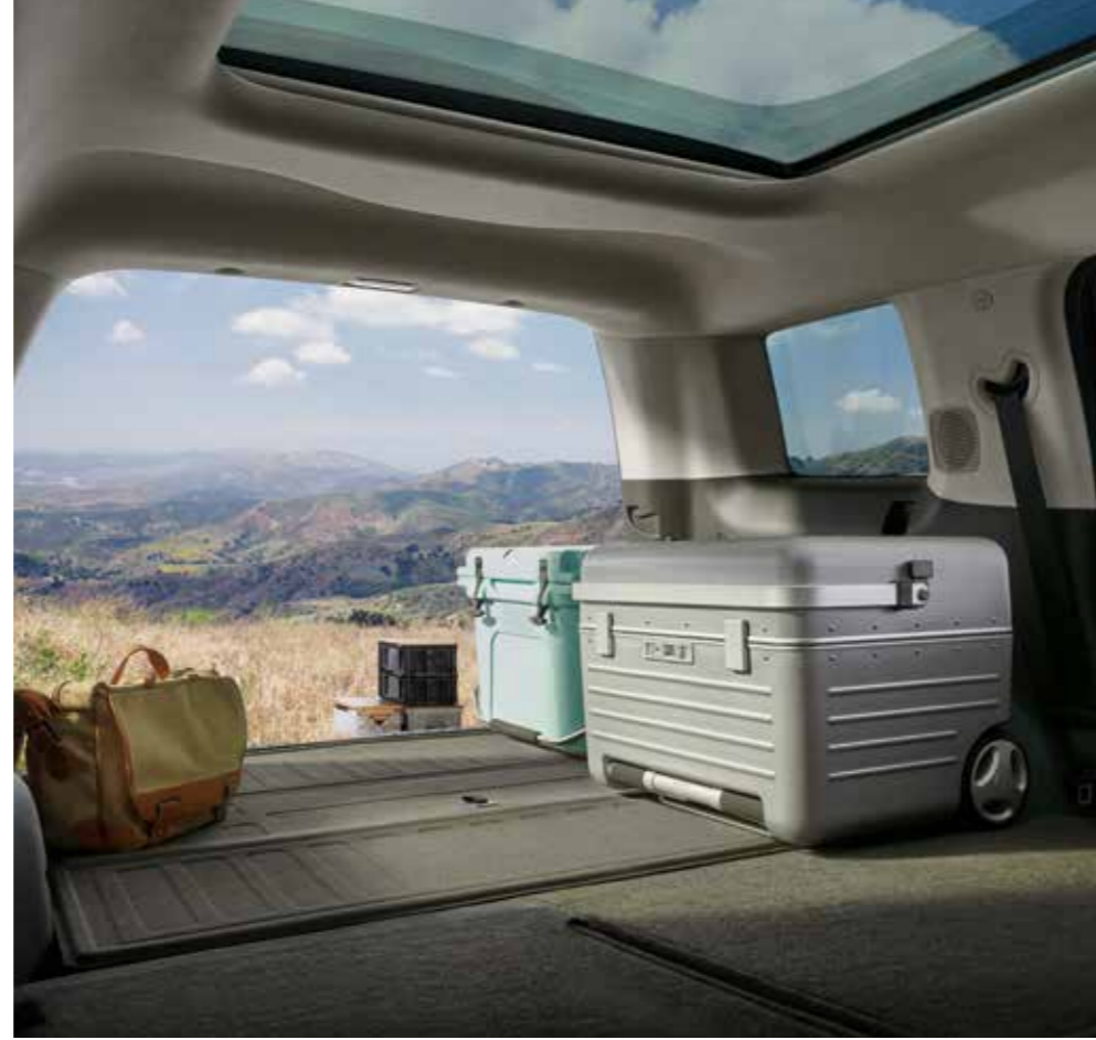
2'nci sıra katlanan koltuklar

SANTA FE, 7 koltuklu geniş araç içiyle büyük konfor sunuyor, hep daha fazlasına olanak tanıyor.