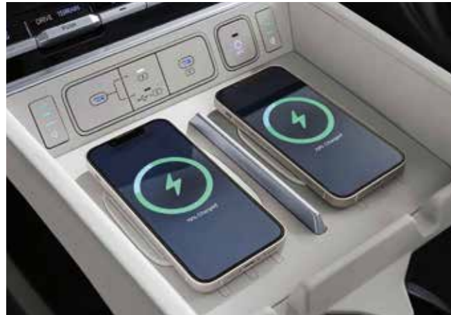
BOSE® premium ses sistemi Çift kablosuz şarj