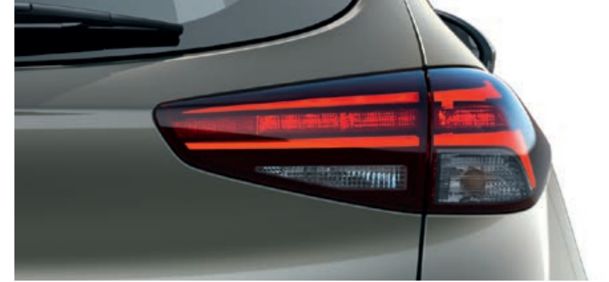
Yeni LED arka far grubu.