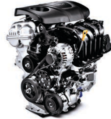
1.6 GDI 132 PS Benzinli