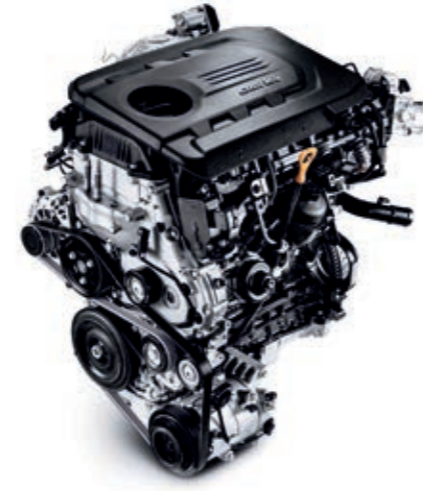
1.6 CRDi 136 PS Dizel