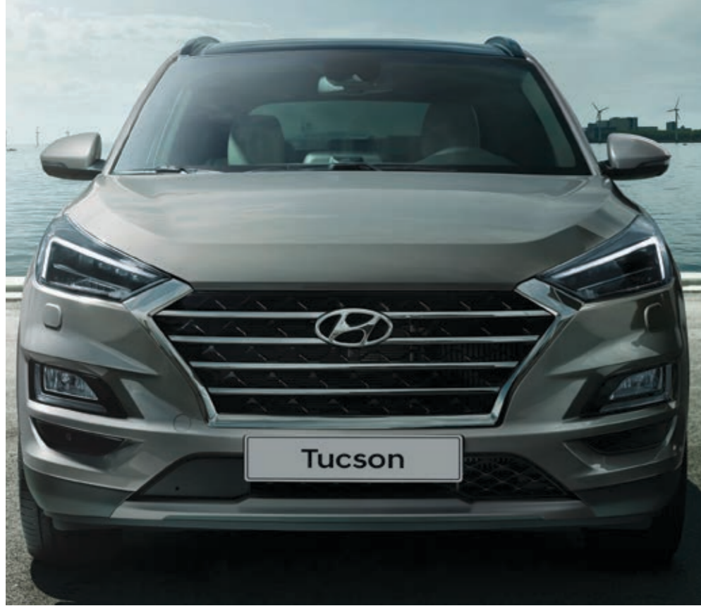
Hyundai'nin imzası hâline gelen Basamaklı Izgara, şimdi yeni Tucson'da.

Dikkat çekici tasarım unsurlarını bir arada sunan Tucson'un geçirdiği değişim, onu her göreni şaşırtıyor.