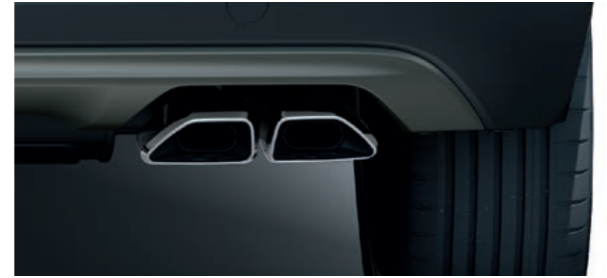
Yeni ikiz krom egzoz uçları.