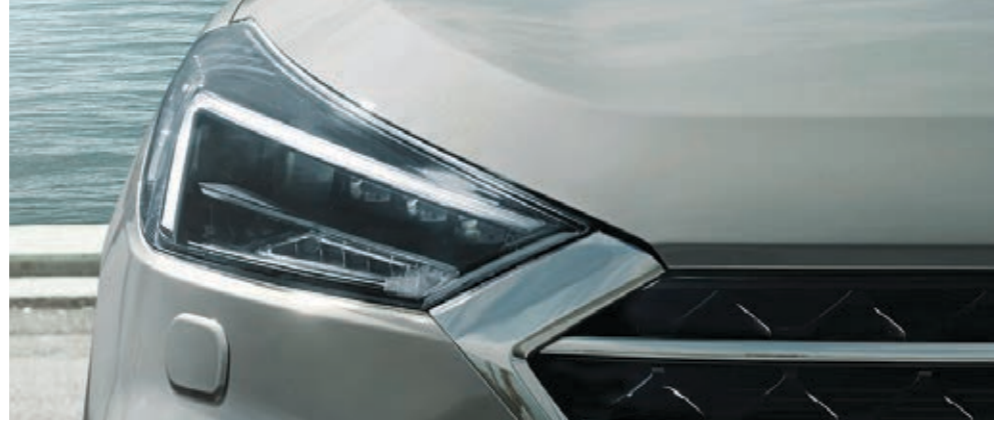
Uzun Far Asistanı özellikli Full LED ön farlar.