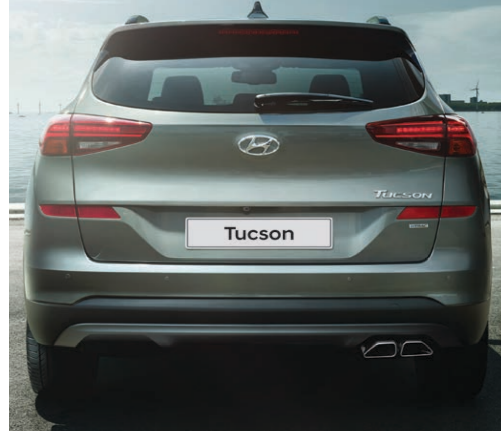
Yeniden tasarlanan arka tampon ve yeni LED arka far grubu.