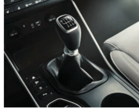
6 ileri manuel şanzıman