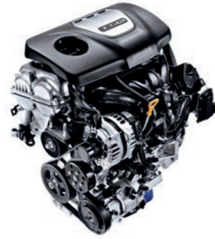
1.6 T-GDI 177 PS Benzinli