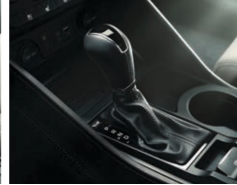
7 ileri çift kavramalı DCT şanzıman