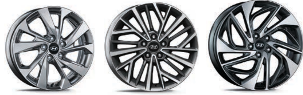
17" alaşımli jant