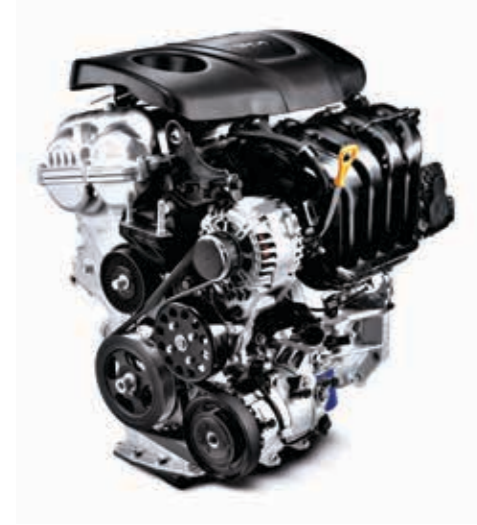
1.6 GDI 132 PS Benzine