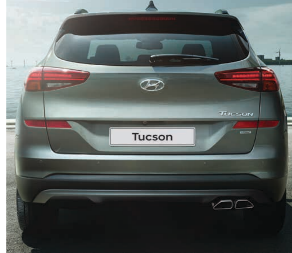
Yeniden tasarlanan arka tampon ve yeni LED arka far grubu.