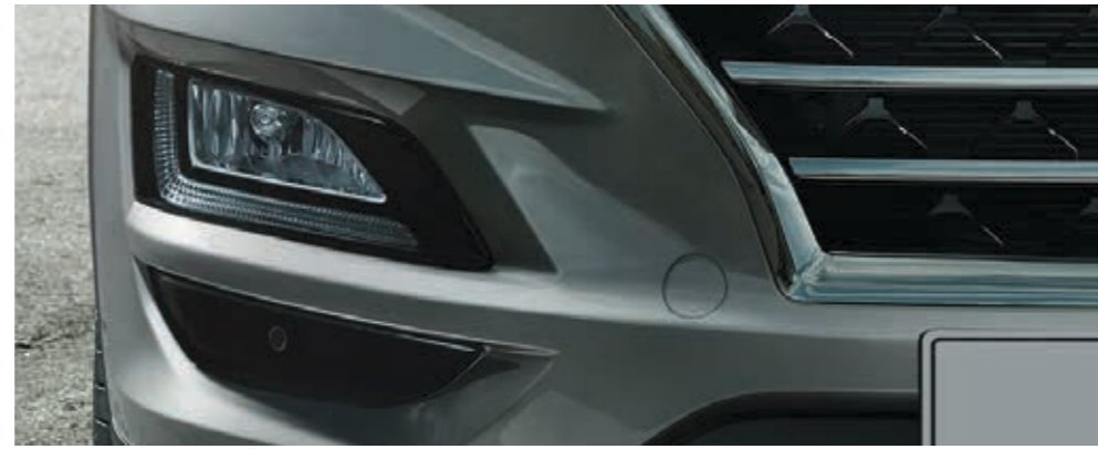
Uzun Far Asistanı özellikli Full LED ön farlar.