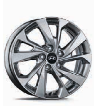
17" alaşımli jant