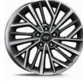
18" alaşımli jant