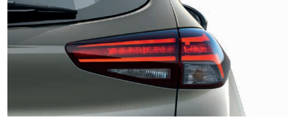
Yeni LED arka far grubu.