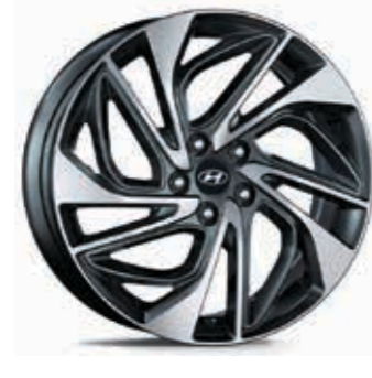
19" alaşımli jant