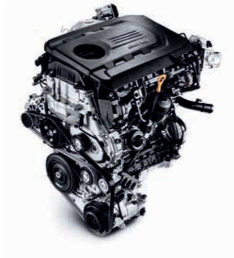
1.6 CRDi 136 PS Dizel