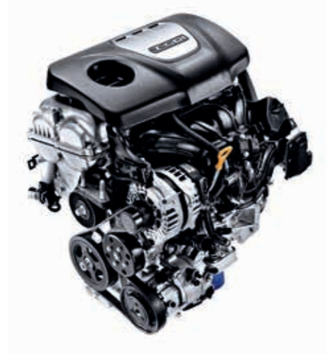
1.6 T-GDI 177 PS Benzine