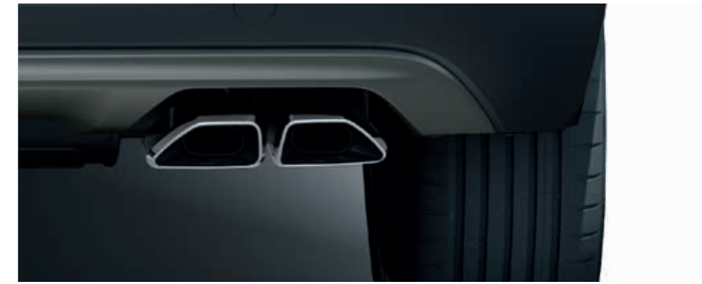
Yeni ikiz krom egzoz uçları.