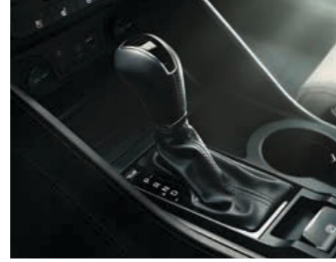
7 ileri çift kavramalı DCT şanzıman