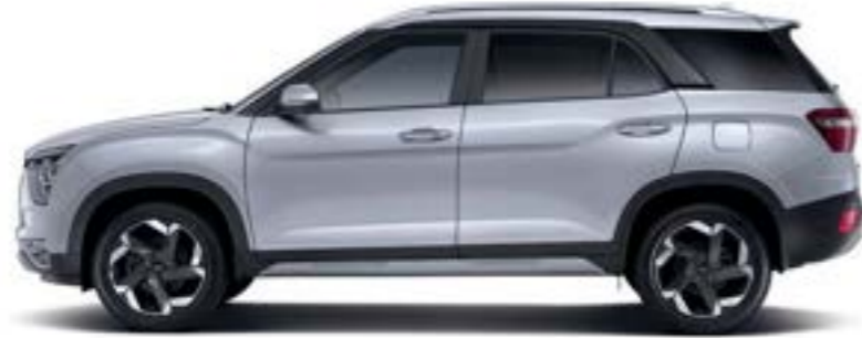
4,500 2,760 الطول الإجمالي قاعدة العجلات