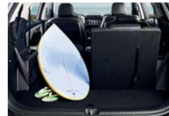
مساحة تخزين متعددة الاستخدامات

يعمل صندوق الكونسول الرئيسي متعدد الاستخدامات كمسند ذراع مبطن وصندوق تخزين سهل الاستخدام ويتوفر مع شاحن هاتف لاسلكي وحاملات أكواب مزدوجة مدمجة.