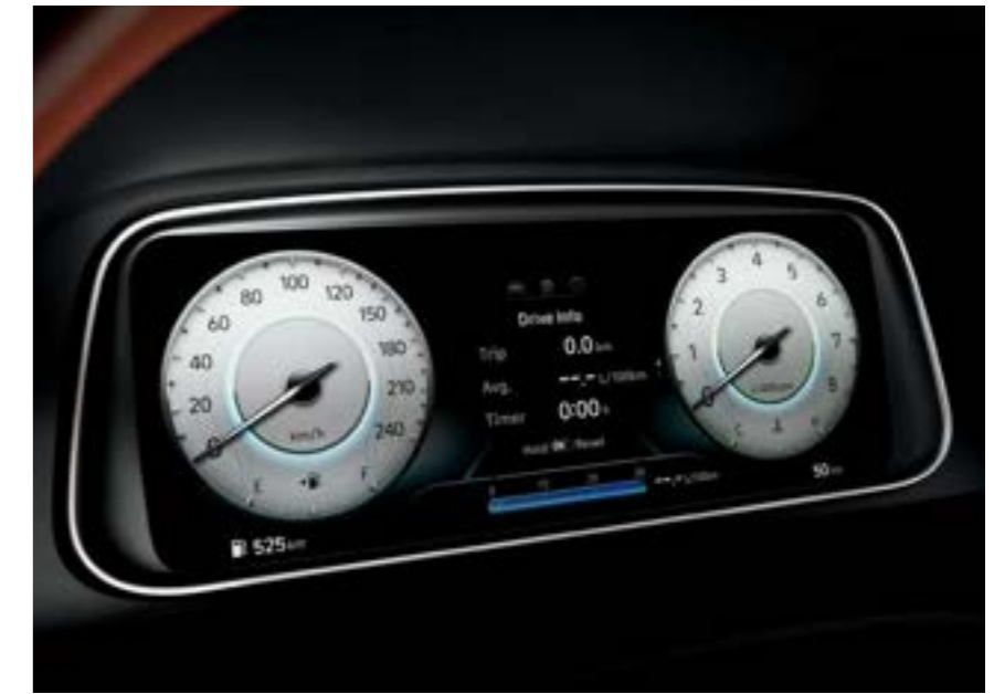
مجموعة عدادات LCD TFT مقاس 10.25 بوصة