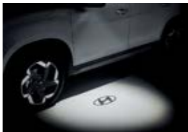
مصباح في المرأة الخارجية مع شعاع هينوداي