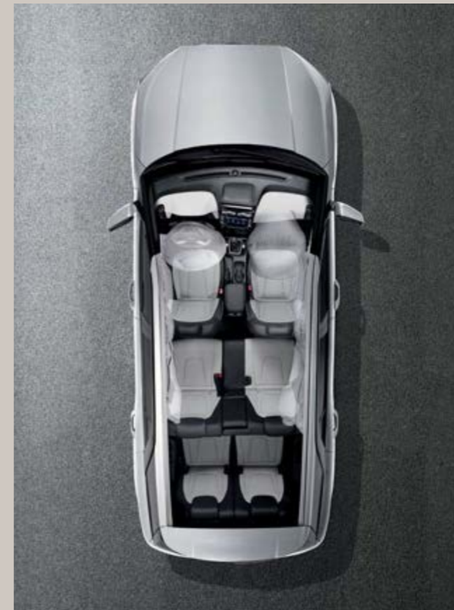
نظام من 6 وسائد هوائية (السائق، الراكب، وسادة هوائية جانبية وستارية)

عند تشغيل إشارات الاعتفاف. يتم عرض صورة الجانب الخلفي للاتجاه المقابل على الشاشة.