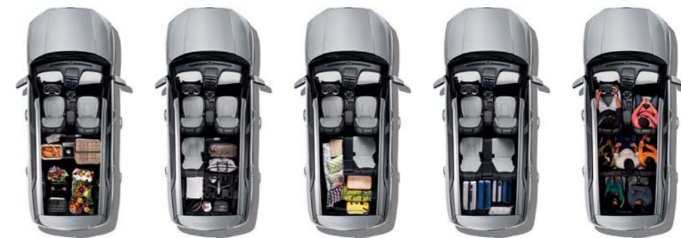
7 مقاعد مقاعد الصف الثالث مطوية مقاعد الصف الثاني مطوية بنسبة 40% مقاعد الصف الثالث مطوية مقاعد الصف الثاني مطوية بنسبة 60% مقاعد الصف الثاني ومقاعد الصف الثالث مطوية

كرينا جراند تفي بوعدها لتكون أكثر السيارات أناقة وجاذبية، فمقصورتها الفريدة تحيطك بكافة وسائل الأمان والراحة، وتتميز بلمسات فخمة وإضافات مدروسة وتفصيل دقيقة تمنحك بهجة خالصة وسعادة لا حدود لها. صُممت سيارة كرينا جراند لتلقت الأنظار وترك انطباع لا يمكن تجاهله كيفما تجولت، بدءاً من أليتها المبتكرة المستخدمة والمقاعد القابلة للتعديل وصولاً إلى المساحة الرحبة للمقصورة ذات اللونين والمقاعد الجلدية المثقبة التي تخلق جواً فاخراً.