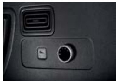
فتحات تهوية بالصف 3 وتحكم بالسرعة (3 مراحل)