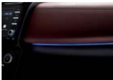
مصباح خافت بـ 64 لون

* قد تختلف المزايا والمواصفات حسب كل سوق. الرجاء مراجعة وكيلك المحلي