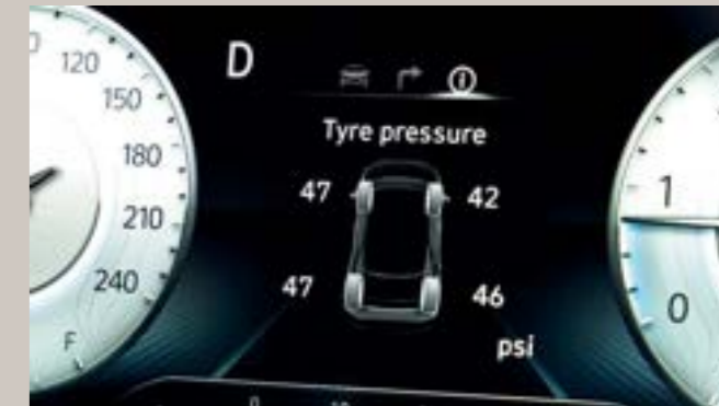
نظام مراقبة ضغط الإطارات (TPMS)

تتوفر في سيارات كرينا جراند 6 وسائد هوائية، وسائد للسائق والراكب بالإضافة إلى وسادتين جانبيتين لحماية الصدر والحوض. بينما توفر الوسادتان الجانبيتان في اليمين واليسار حماية لرؤوس ركاب السيارة.