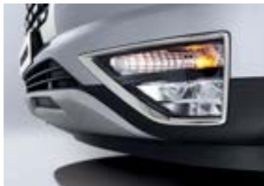
مصابيح ضباب أمامية (LED MFR)