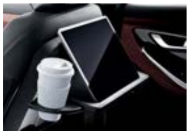
طاولة في ظهر المقاعد الأمامية مع حامل أكواب قابل للإغلاق وحامل جهاز لوجي