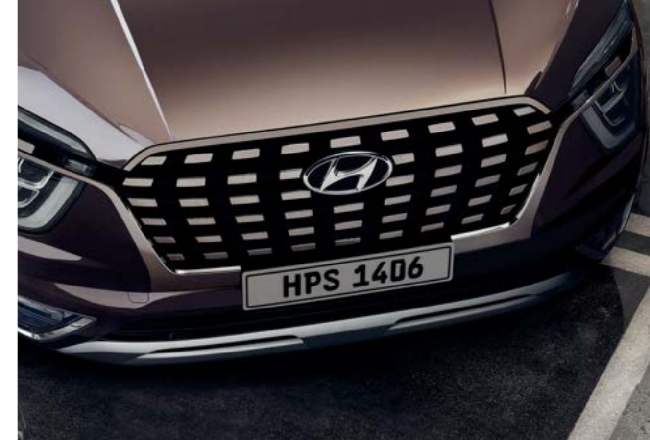
شبكة أمامي ذو شكل متقاطع خاص مطلي بالكروم