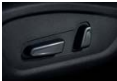
مقعد السائق بضبط كهربائي إلى 8 وضعيات