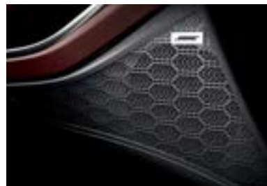
نظام صوتي راقي BOSE