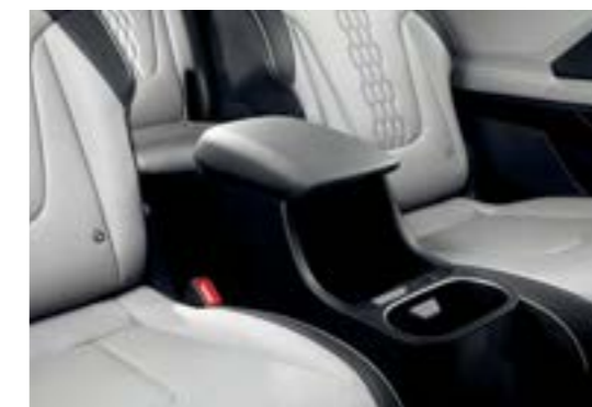
صندوق في كونسول الصف الثاني (6 مقاعد)

ما عليك سوى ضغط الزر لتحريك مقاعد الصف الثاني إلى الأمام والخلف، أو طي مساند الظهر نحو الأسفل لتتيح لركاب الصف الثالث الدخول والخروج بسهولة.