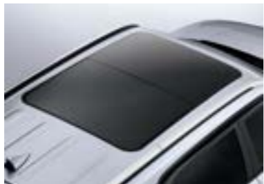
فتحة سقف بانورامية