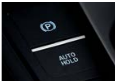
نظام كبح إلكتروني عند ركن السيارة مع توقف آلي