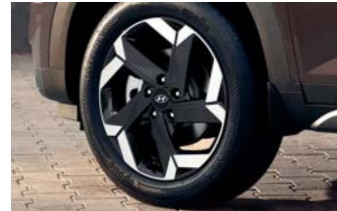
مصابيح أمامية LED مع مصابيح نهائية LED DRL عجلات معدنية بقصة الألماس مقاس 18 بوصة