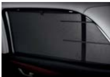
ستارة يدوية بالباب الخلفي