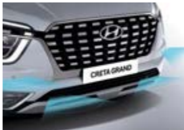
نظام تنبيه للمسافة الأمامية