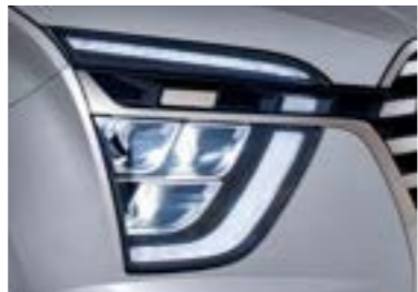
مصابيح أمامية MFR LED ومصابيح LED نهائية