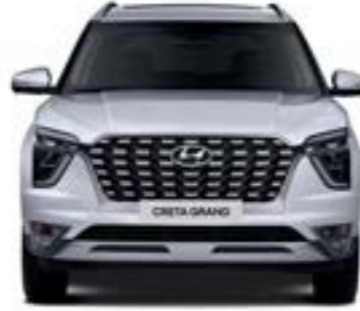
1,790 1,595.5 العرض الإجمالي مداس العجلات