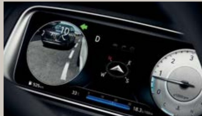
شاشة مراقبة المنطقة العمياء (BVM)

عند تشغيل إشارات الاعتفاف. يتم عرض صورة الجانب الخلفي للاتجاه المقابل على الشاشة.