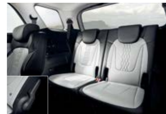
نظام طي مقاعد الصف الثاني ومقاعد الصف الثالث

ما عليك سوى ضغط الزر لتحريك مقاعد الصف الثاني إلى الأمام والخلف، أو طي مساند الظهر نحو الأسفل لتتيح لركاب الصف الثالث الدخول والخروج بسهولة.