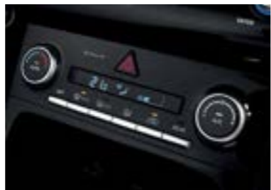
نظام تكييف هوائي أوتوماتيكي بالكامل