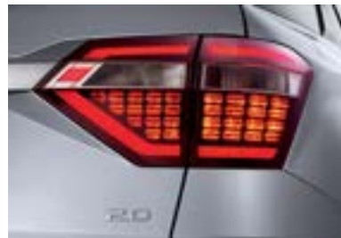
مجموعة مصابيح خلفية LED