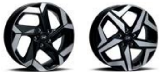
عجلات معدنية 18 بوصة

قد لا تكون واثقاً أحياناً من مدى سهولة وأمان الطريق أمامك. ولذا تم تجهيز سيارة كرينا جراند بأنظمة سلامة متطورة توفر لك راحة البال الكاملة. حيث تعمل الأجزاء القابلة للتصادم الخاصة كحط دفاعك الأول. صممت الهياكل المصنوعة من الفولاذ شديد المقاومة والمدمجة في المناطق المهمة. لكي تمتص قوة الصدمات بشكل آمن. بينما تعمل على حماية ركاب المقصورة في حالة حدوث تصادم. يعمل نظام مراقبة النقطة العمياء على نقل الصورة في المنطقة العمياء وينبهك إذا حاولت الانتقال بشكل غير آمن بالمسار.