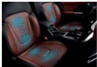
مقاعد أمامية مهواة