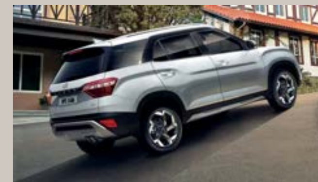
نظام تحكم للمساعدة عند المرتفعات

يساعدك نظام مراقبة ضغط الإطارات على تحقيق أفضل اقتصاد في استهلاك الوقود وإطالة عمر الإطارات من خلال تنبيهك عن حالة الإطارات وما إذا كانت بحاجة إلى معاينة أم لا.