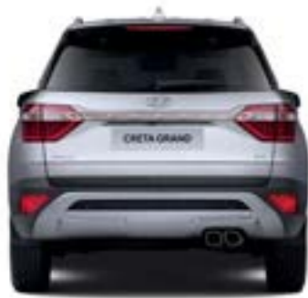
1,564.3 مداس العجلات