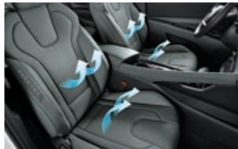
مقاعد مهواة (الصف الأول)