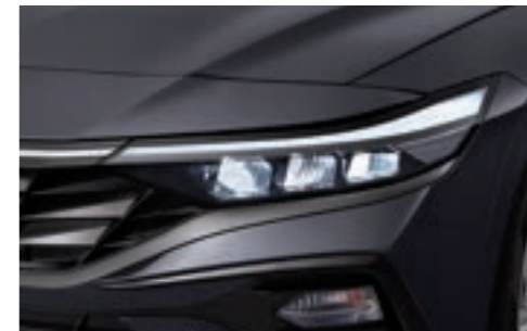
مصابيح أمامية LED كاملة نوع(MFR)