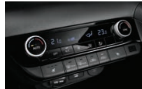
مكيف هواء آلي مزدوج