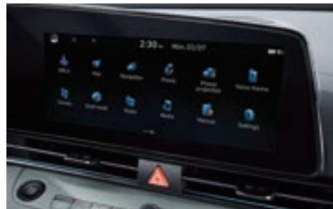
شاشة ملاحه مقاس 10.25 بوصة