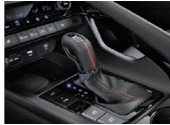
عجلة القيادة الرياضية الحصرية لخط N مع مبدلات سرعة ممتدة مقبض التروس الجلدي الحصري لخط N