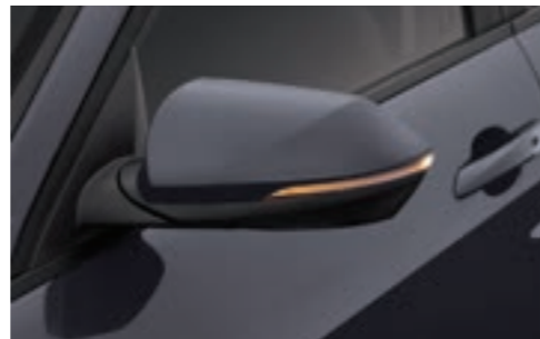
مرايا جانبية خارجية (قابلة للتسخين، قابلة للطي، مؤشرات انعطاف LED)