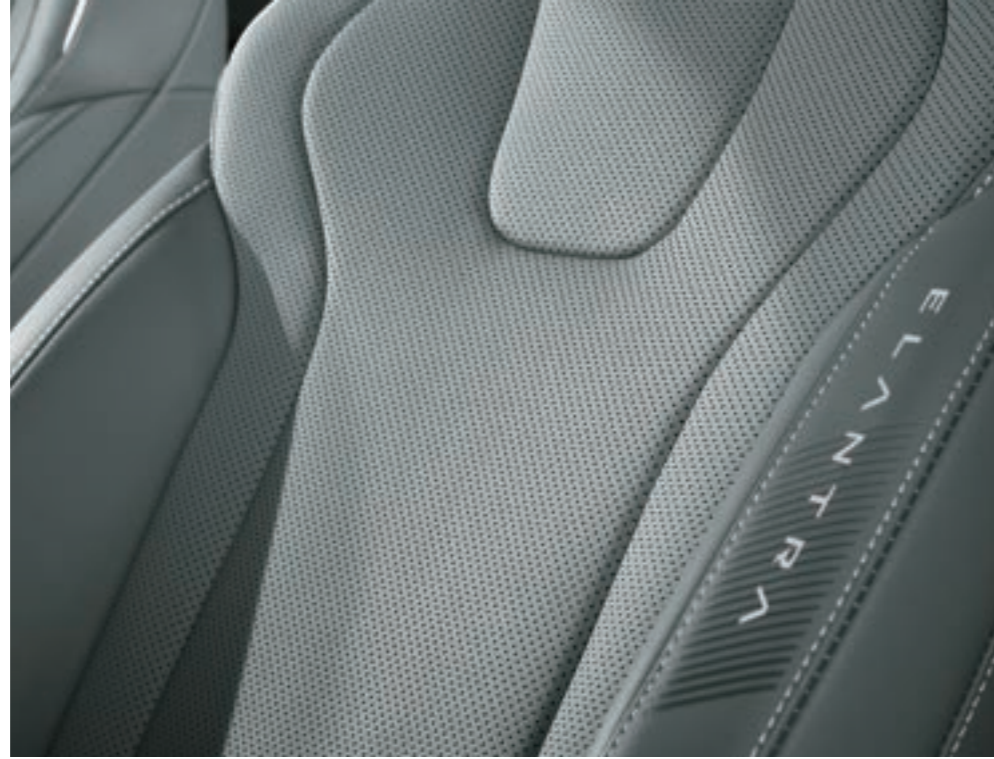
مقعد من الجلد الاصطناعي صديق للبيئة

زخرفة وسادة الصدم من جانب الراكب وتزيين الباب العلوي بمواد فاخرة.