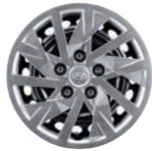
عجلات وأغطية من الصلب 15"