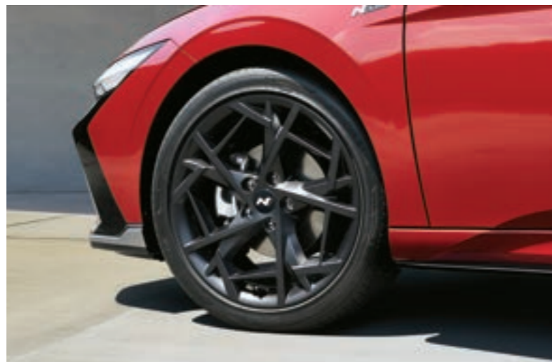
عجلات وإطارات سبائك الألمنيوم مقاس 18 بوصة حصرية لخط N