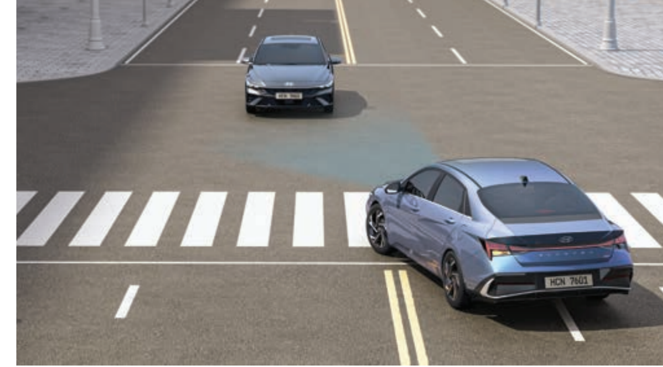
نظام المساعدة في تجنب الاصطدام الأمامي (FCA)

عند فتح الراكب الباب للخروج من السيارة بعد التوقف، وفي حالة الكشف عن سيارة تقترب من الخلف، فإن النظام يقدم تحذيراً ويساعد في الحفاظ على إغلاق الباب الخلفي عبر تفعيل قفل الأطفال الإلكتروني.