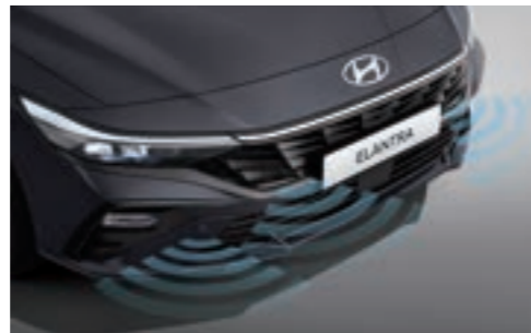
تحذير مسافة الوقوف (أمامي/ خلفي)