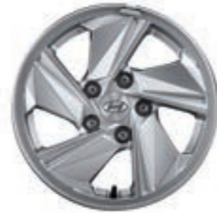
عجلات من سبائك الألومنيوم 15"