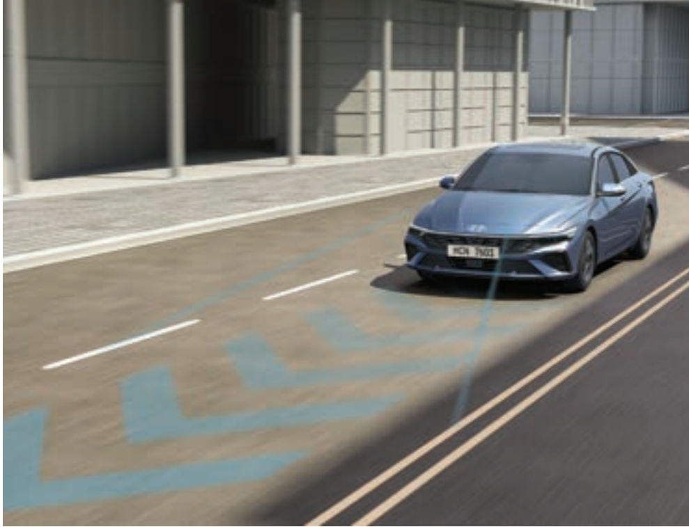
نظام المساعدة على متابعة المسار (LFA) يساعد في توجيه السيارة إلى مسارها الأوسط.