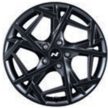
عجلات من سبائك الألومنيوم 18" (N Line)