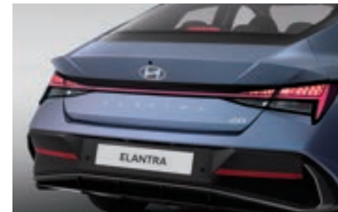
مصابيح خلفية LED مركبة