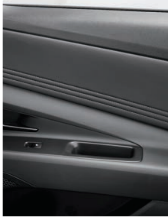
الداخلية المطلية بلمسة ناعمة

يخلق التصميم الداخلي عالي التقنية والمواد الصديقة للبيئة أجواء أكثر رفقا وتطورا.