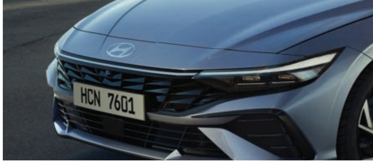
مصابيح أمامية LED كاملة من النوع الرفيع

تقدم إنترا الجديدة هالة حيوية من خلال الحمض النووي لـ "ديناميات بارامترية" ونسب تصميم مطورة.