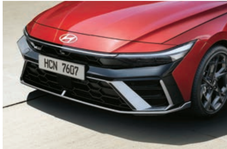
الصدام الأمامي الحصري لخط N