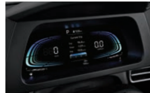
عنقود(شاشة LCD ملونة مقاس 4.2 بوصة)