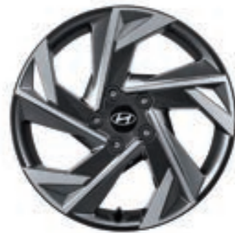
عجلات من سبائك الألومنيوم 17"