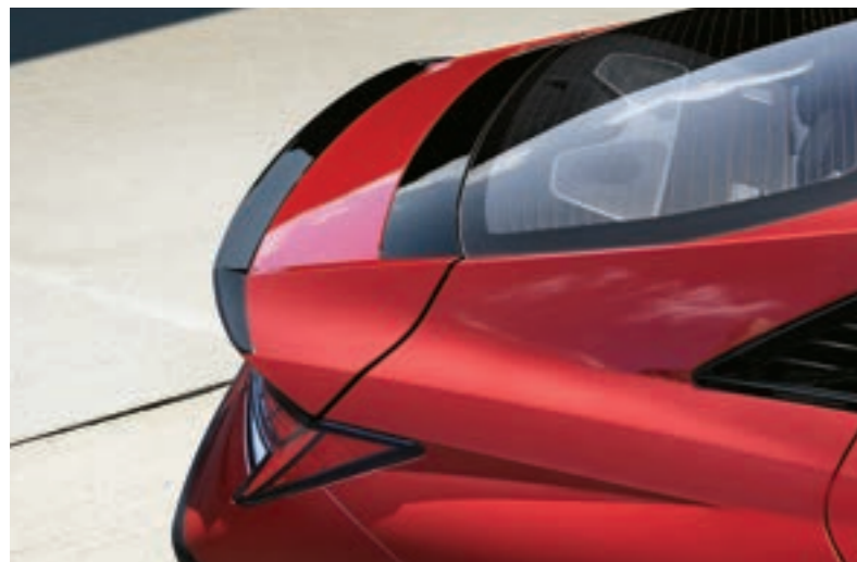
السبويلر الخلفي الحصري من نوع الشفة لخط N