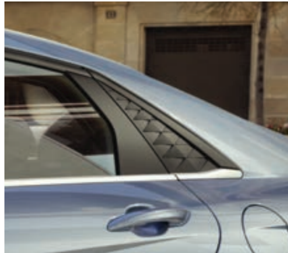
غطاء زجاج الربع