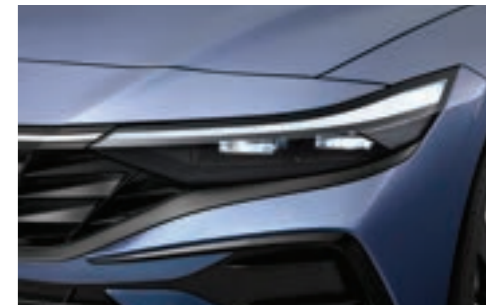
مصابيح أمامية LED كاملة من النوع الرفيع