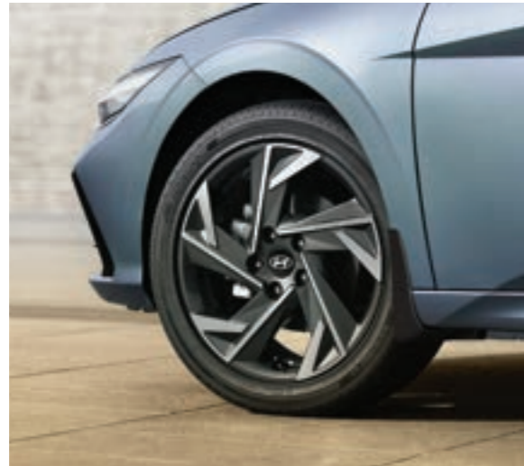
عجلات وإطارات من سبائك الألومنيوم 17"