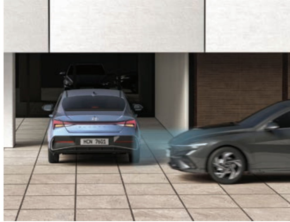
نظام منع الاصطدام عند المرور الخلفي (RCCA) يقدم تحذيراً إذا كان هناك خطر الاصطدام مع مركبة قادمة من الجانب الأيسر أو الأيمن أثناء الرجوع إلى الخلف. بعد التحذير، إذا ازداد خطر الاصطدام، فإنه يساعد تلقائياً في الفرملة الطارئة.