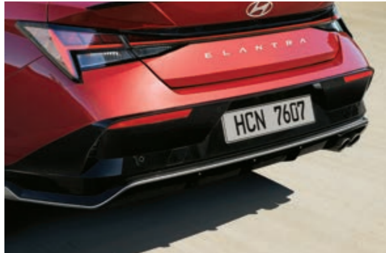
الصدام الخلفي الحصري لخط N

يضيف تصميم خط N الحصري لمسة ديناميكية وأنيقة إلى المظهر الخارجي الرياضي.