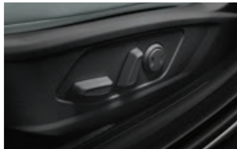
مقعد السائق الكهربائي (8 وضعيات، دعم العمود الفقري القطني)