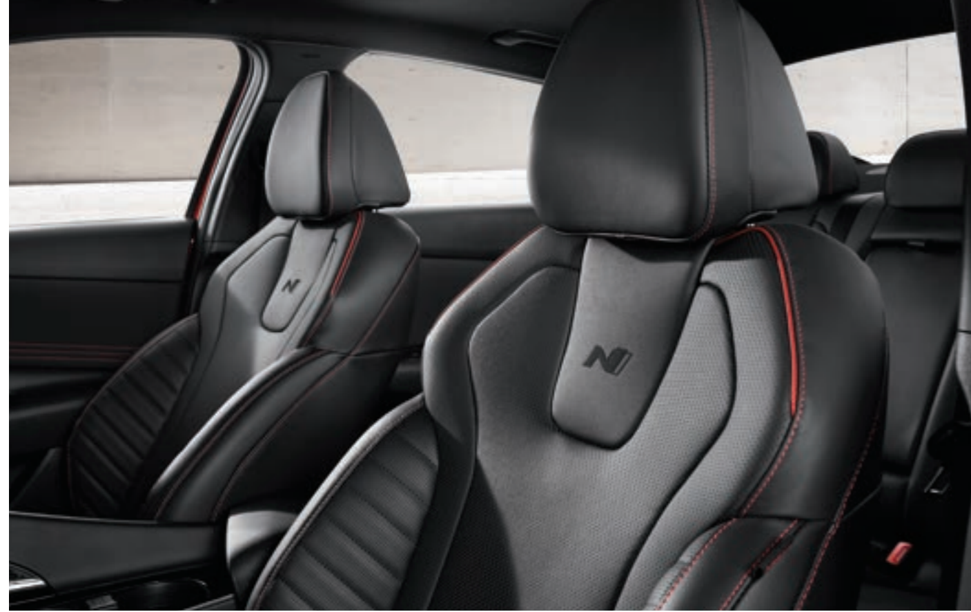
مقاعد خط N الحصرية من الجلد الأصيل

يوفر التصميم الحصري مع جينات N عالية الأداء واللمسة الحمراء تجربة قيادة غامرة.