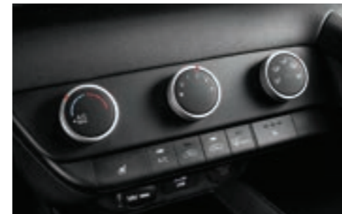
مكيف هواء يدوي