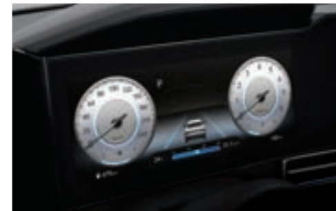
عنقود(شاشة LCD ملونة مقاس 10.25 بوصة)