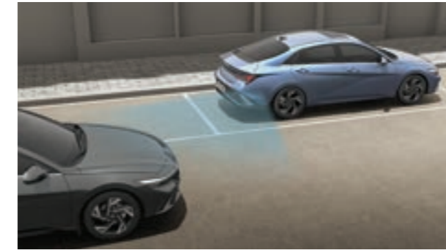
نظام المساعدة في تجنب الاصطدام بالنقطة العمياء (BCA)

يحذرك في حالة وجود خطر الاصطدام بسيارة جانبية خلفية في النقطة العمياء أثناء تغيير المسار. بعد التحذير، إذا ازداد خطر الاصطدام، يقوم بالتحكم التلقائي في السيارة لمساعدة في تفادي الاصطدام. عند الخروج للأمام من موقف للركن الموازي، إذا كان هناك خطر الاصطدام بسيارة تقترب من الخلف، فإنه يقدم مساعدة تلقائية بالفرملة الطارئة.