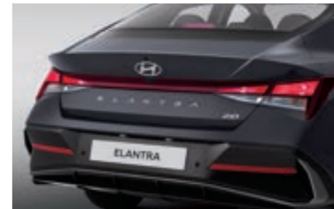
مصابيح خلفية مركبة