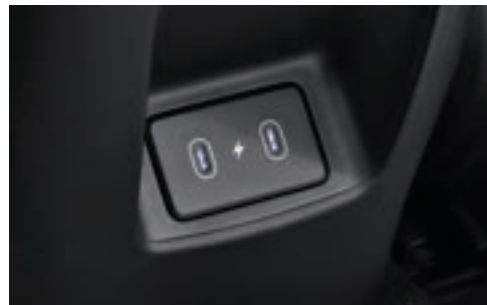
شاحن من نوع (USB-C) الصف الثاني