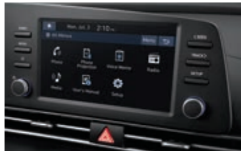
نظام عرض صوتي مقاس 8 بوضات (مطفاً، عند اختيار عنقود LCD ملون 4.2")