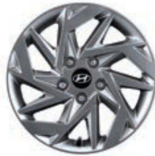
عجلات من سبائك الألومنيوم 16"