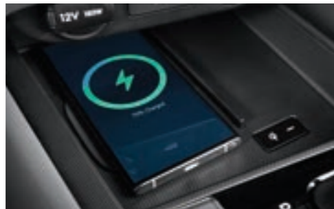
شاحن الهاتف الذكي اللاسلكي