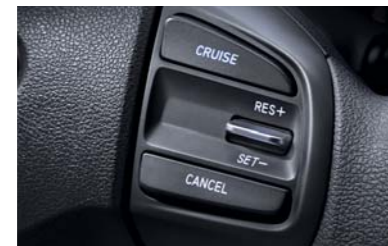
مفتاح تثبيت السرعة