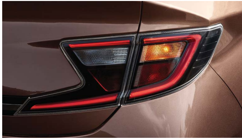
مجموعة مصابيح خلفية إنسيابية