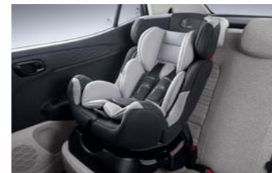
نظام تثبيت مقعد الطفل إيزوفيكس