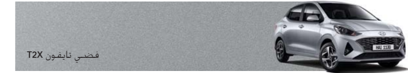
فضي تايفون T2X