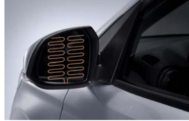
مرايا جانبية قابلة للتدفئة