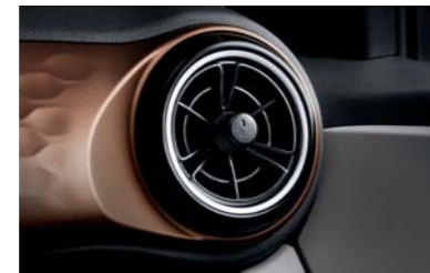
فتحات تهوية بموديل مروحة فريدة من نوعها