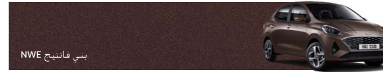
بني فانتيج NWE