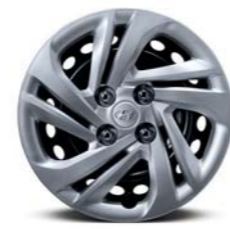
غطاء عجلة فولاذي مفاص 14 بوصة