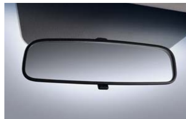
مرآة للمشاهدة الخلفية أثناء النهار والليل