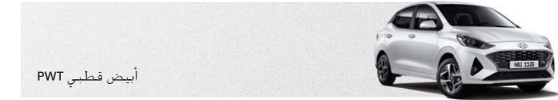
أبيض قطبي PWT