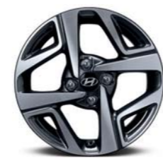
عجلات معدنية 15 بوصة