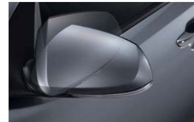
مرايا جانبية تطوى كهربائياً