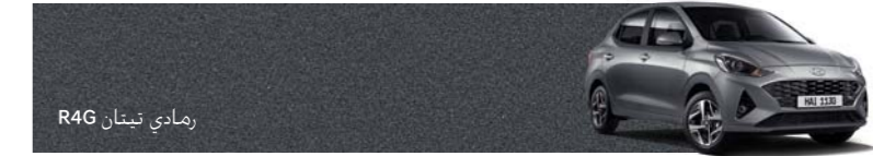
رمادي تيتان R4G