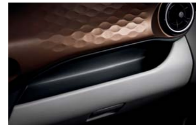
حيز تخزين عملي