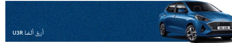
أزرق ألفا U3R