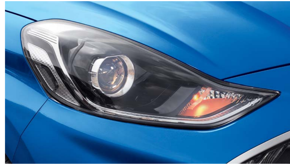
مصابيح أمامية عاكسة