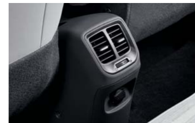
فتحات تكييف هوائي خلفي