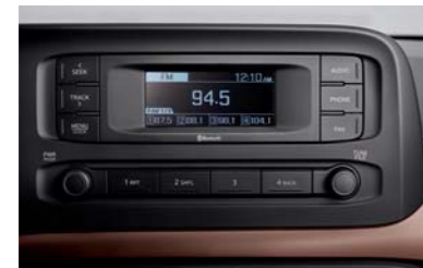
راديو + RDS