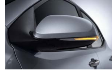
مرايا خارجية مع مصابيح إشارة