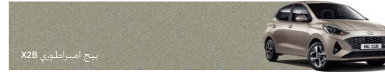
بيح اميراطوري X2B