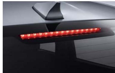
مصباح توقف علوي (LED)