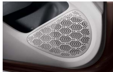
أربعة مكبرات صوت أمامية/خلفية