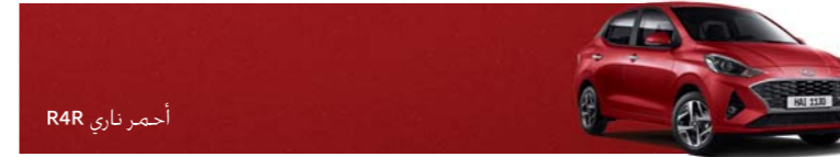
أحمر ناري R4R