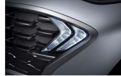
مصابيح نهائية LED تعمل باستمرار (DRL)