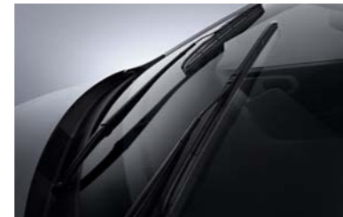
مستاحات زجاج نوعية Aero