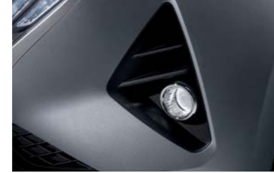
مصابيح ضباب أمامية