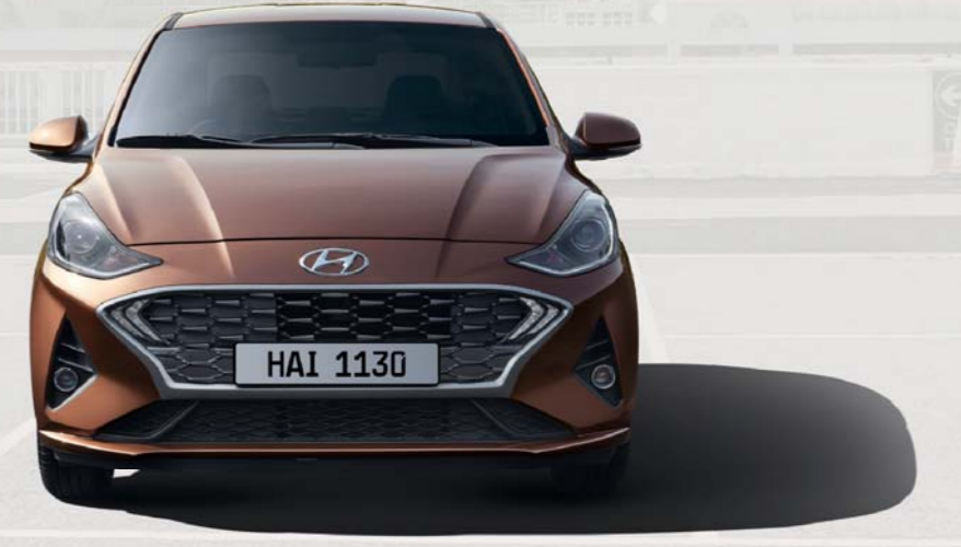
التصميم الأمامي / شبك فضي لامع

جراند i10 ليست مجرد سيارة عادية، فهي عصرية ورياضية وقادرة على مساعدتك في إنجاز مهامك بأسلوب أنيق ومتميز، ولا شك أنك ستقع في حبها من النظرة الأولى. تبدو هذه السيارة رائعة في جميع عناصر تصميمها الأساسي، ويمكنك إضافة بعض التفاصيل المهمة التي تجعلها تنفرد عن السيارات الأخرى في فئتها. مثل اختيار الإطارات المعدنية مقاس 15 بوصة، والمصابيح الخارجية المتطورة من نوع LED وغيرها الكثير.