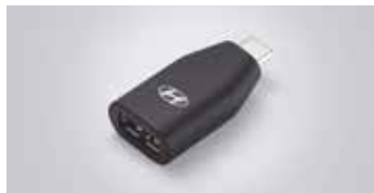
C to USB-A 변환 젠더

※ C to USB-A 변환 젠더는 현대자동차 전용 개발 제품으로 타 제품 및 타 자동차 브랜드에서는 작동을 보장하지 않습니다.