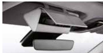
선바이저 선글라스 케이스