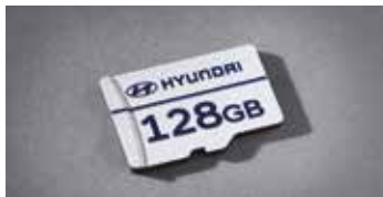
빌트인 캠 2 전용 마이크로SD 카드(128GB)