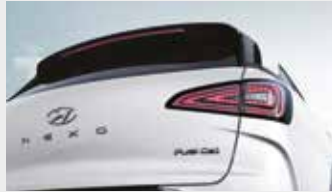
LED 리어 콤비 램프/히든 리어 와이퍼