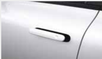
오토플러시 도어 핸들