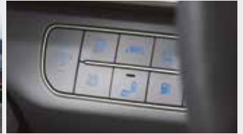
물 배출 스위치