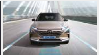
차로 유지 보조/차로 이탈방지 보조/ 고속도로 주행 보조