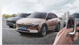
원격 스마트 주차 보조

머릿속으로만 그려왔던 미래가 혁신적인 모빌리티의 모습으로 눈앞에서 펼쳐집니다. 다가올 미래를 일상에서 먼저 누리는 특별한, 그 중심에 NEXO가 있습니다.