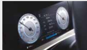
클러스터(10.25인치 컬러 LCD)