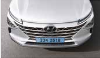
호라이즌 포지셔닝 램프/ 분리형 컴포지트 LED 헤드램프/캐스캐이딩 그릴

좌우를 연결하는 호라이즌 포지셔닝 램프와 공기역학을 고려해 설계된 오토플러시 도어 핸들이 미래지향적인 이미지를 완성해줍니다.