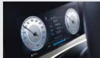
클러스터(10.25인치 컬러 LCD)