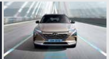
차로 유지 보조/차로 이탈방지 보조/ 고속도로 주행 보조