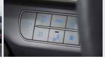
물 배출 스위치