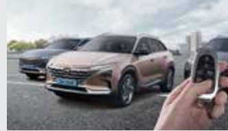
원격 스마트 주차 보조

머릿속으로만 그려왔던 미래가 혁신적인 모빌리티의 모습으로 눈앞에서 펼쳐집니다. 다가올 미래를 일상에서 먼저 누리는 특별한, 그 중심에 NEXO가 있습니다.