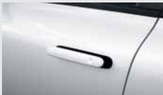
오토플러시 도어 핸들