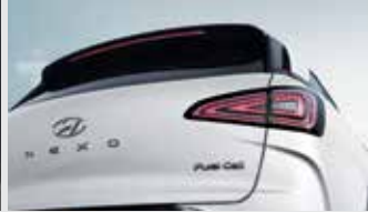
LED 리어 콤비 램프/히든 리어 와이퍼