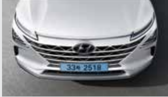
호라이즌 포지셔닝 램프/ 분리형 컴포지트 LED 헤드램프/캐스캐이딩 그릴

좌우를 연결하는 호라이즌 포지셔닝 램프와 공기역학을 고려해 설계된 오토플러시 도어 핸들이 미래지향적인 이미지를 완성해줍니다.