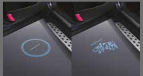
개인맞춤형 LED 도어 스팟 램프