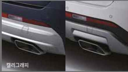
듀얼머플러 패키지 [84만원]