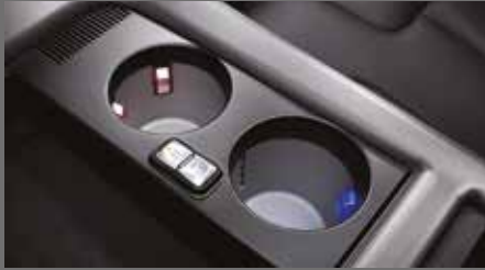
냉온장 컵홀더 [49만원]