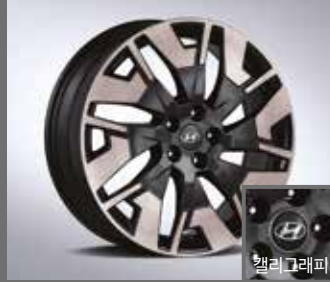
20인치 블랙톤 전면 가공 휠 [84만원]

※ 알콘(alcon) 단조 브레이크 패키지는 프론트에만 적용됩니다. ※ 20인치 다크 스포터링 휠과 알콘(alcon) 단조 브레이크는 동시 선택이 불가능합니다.(20인치 블랙톤 전면 가공 휠만 가능) ※ 커스터마이징 상품 애프터마켓 판매처: 현대 Shop(Shop.Hyundai.com) 현대브랜즈관 ※ N Performance parts는 패키지에 따라 적용 가능 트림이 상이합니다.