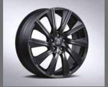
20인치 다크 스포터링 휠 [84만원]

※ 알콘(alcon) 단조 브레이크 패키지는 프론트에만 적용됩니다. ※ 20인치 다크 스포터링 휠과 알콘(alcon) 단조 브레이크는 동시 선택이 불가능합니다.(20인치 블랙톤 전면 가공 휠만 가능) ※ 커스터마이징 상품 애프터마켓 판매처: 현대 Shop(Shop.Hyundai.com) 현대브랜즈관 ※ N Performance parts는 패키지에 따라 적용 가능 트림이 상이합니다.