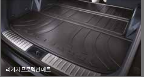
러기지 프로텍션 매트