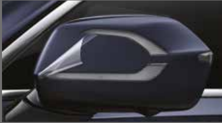
차량 보호 필름 [49만원]