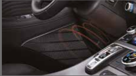
적외선 무릎 워머 [30만원]