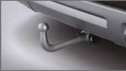
트레일러 패키지 [158만원]