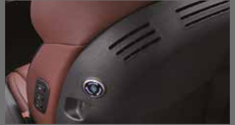
빌트인 공기청정기 [40만원]