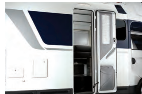
차량 메인키로 열림 잠금이 가능한 메인도어