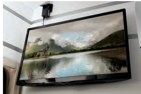
24인치 LED TV (선택) ※ 별도 위성안테나 설치 필요