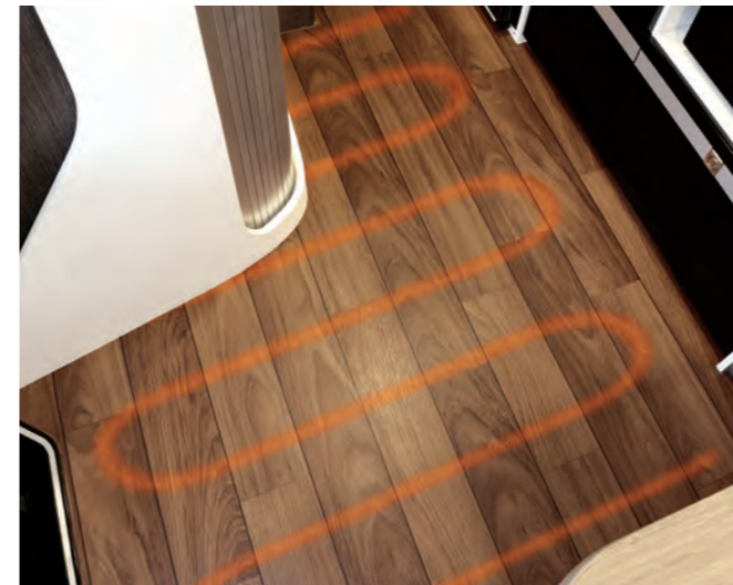
무시동 히터 (온수겸용) / 바닥 난방 (선택) 무시동 히터 및 바닥난방을 설치하여 난방성능이 뛰어납니다.