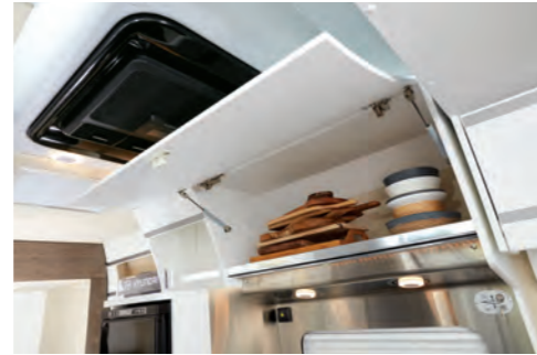
상단 수납함 (스탠다드 / 디렉스)