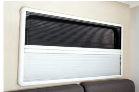
방충망 및 실내 커튼