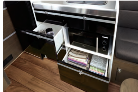
싱크대 수납함 (스탠다드 / 디렉스)