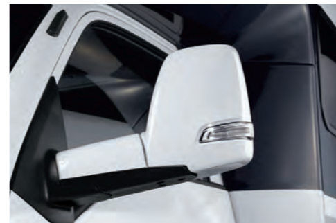
캠핑카 전용 아웃 사이드미러