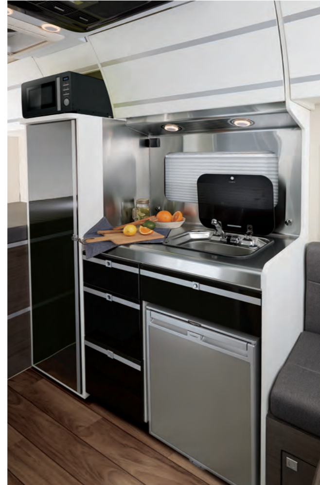
주방공간 (스탠드) 냉장고 80L / 전자레인지