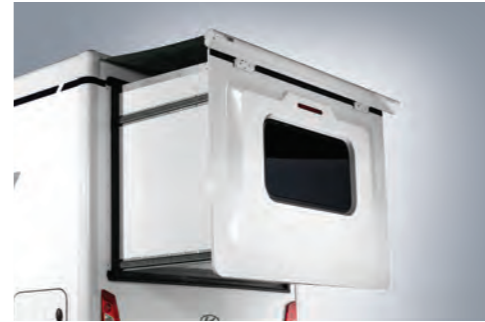
전동식 스마트룸 확장 (디렉스)