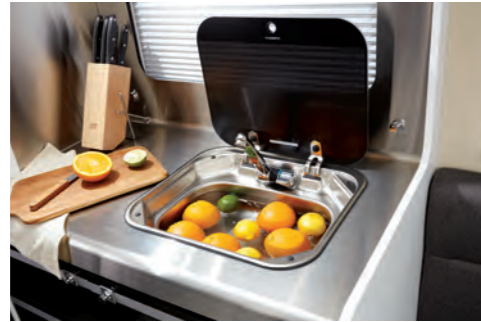
싱크대 (스탠다드 / 디렉스)