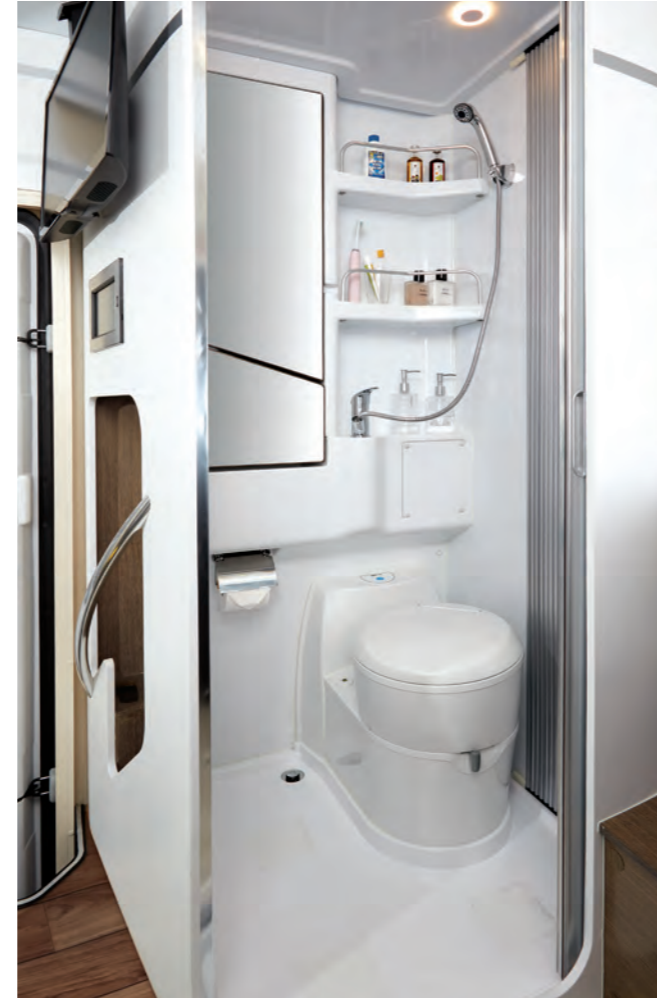
욕실공간 접이식 세면대 / 거울형 수납장 / 슬라이딩도어 / 샤워기 / 좌변기(선택)