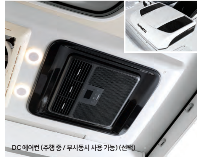
DC 에어컨 (주행 중 / 무시동시 사용 가능) (선택)