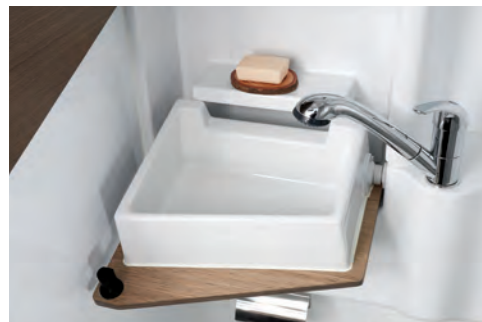
접이식 세면대 (스탠다드 / 디렉스)