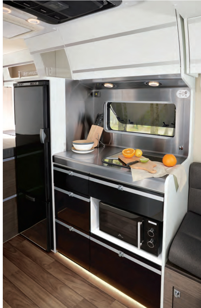
주방공간 (디럭스) 고급형 냉장고 150L / 고급형 전자레인지

스마트폰에 연동하여 실내조명, 실내온도 조절 등의 원격제어가 가능한 포레스트 캠핑카는, 샤워시설을 포함한 화장실은 물론 대용량 냉장고와 전자레인지, 다양한 수납공간 등을 제공하며, 캠핑에 필요한 모든 편의시설이 준비되어 있어 호텔같이 편안하고 자유로운 캠핑이 가능합니다.