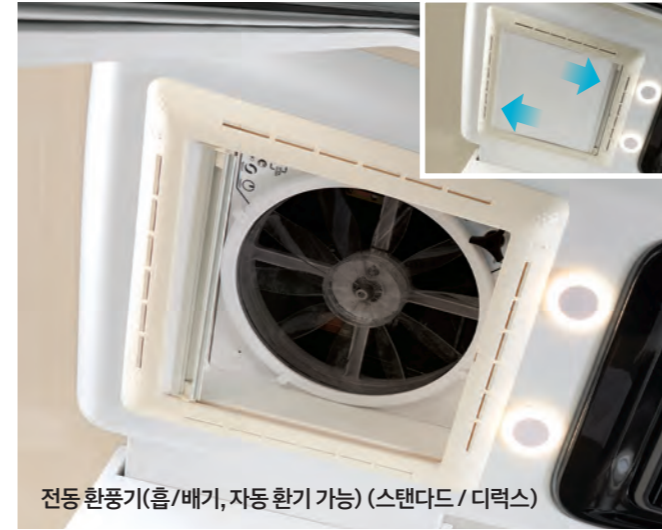
전동 환풍기 (흡/배기, 자동 환기 가능) (스탠다드 / 디럭스)