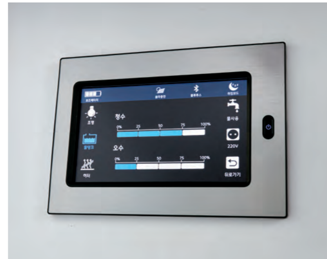
청수 / 오수 (스탠다드 / 디럭스) 청수통 : 100L / 오수통 : 60L