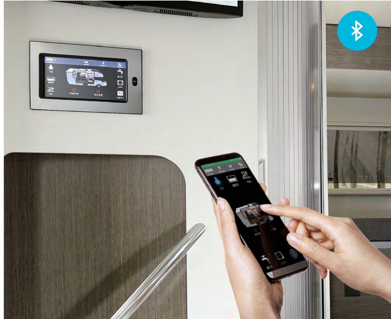
터치식 통합컨트롤러 (스탠다드 / 디럭스) 통합컨트롤러는 블루투스와 연동하여 실내조명, 실내온도 조절 제어가 가능하며 배터리 / 청수·오수 잔량도 쉽게 확인이 가능합니다.

고객님의 쉬운 조작을 위해 조명, 난방, 배터리 사용시간 등에 통합 컨트롤러를 적용하였으며, 블루투스와 연동하여 스마트폰에서도 조작할 수 있어 실용적이고 편리합니다. 또한, 바닥에는 난방을 설치하고 주행 중에도 사용이 가능한 DC 에어컨을 적용하여 휴한기/혹서기에도 레저와 캠핑이 가능합니다.