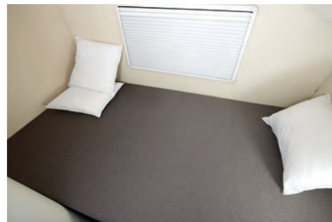
후방 침실 (스탠다드)