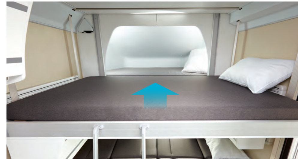
스마트 베드(디럭스) 자유롭게 캠핑(상)을 하고 상부에 설치한 베드를 하향시켜 2층 침대(하)로 조작하면 또 하나의 취침공간이 확보됩니다.