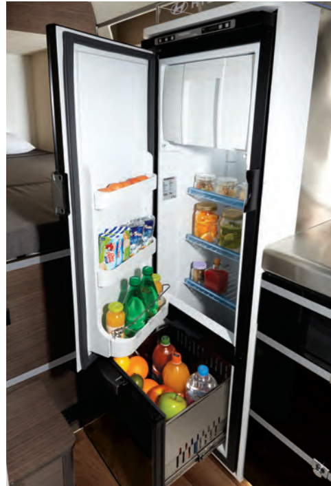
고급형 냉장고 (150L, 디렉스) (스탠다드 선택)