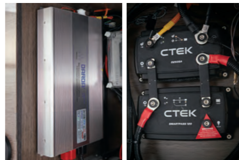
인버터 3K (스탠다드 / 디렉스 선택) / 고성능 충전시스템 (스탠다드 / 디렉스) 220V 콘센트 사용을 위해서는 외부전원과 연결 또는 냉난방패키지(인버터) 선택이 필요합니다.