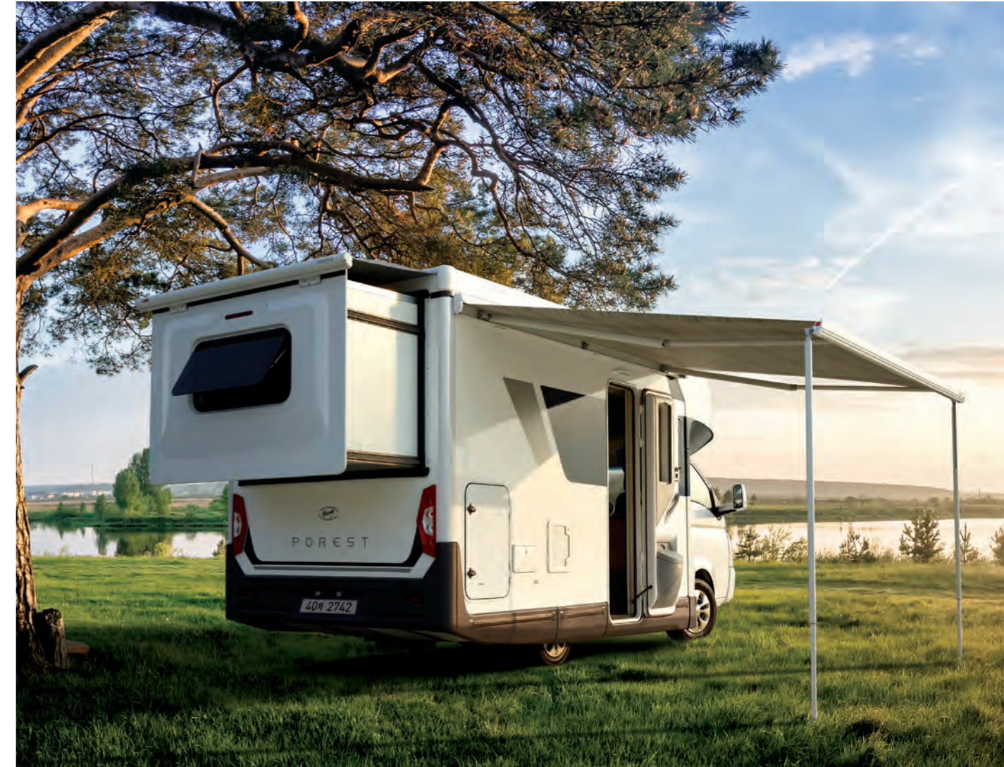
포레스트 캠핑카 (디럭스)