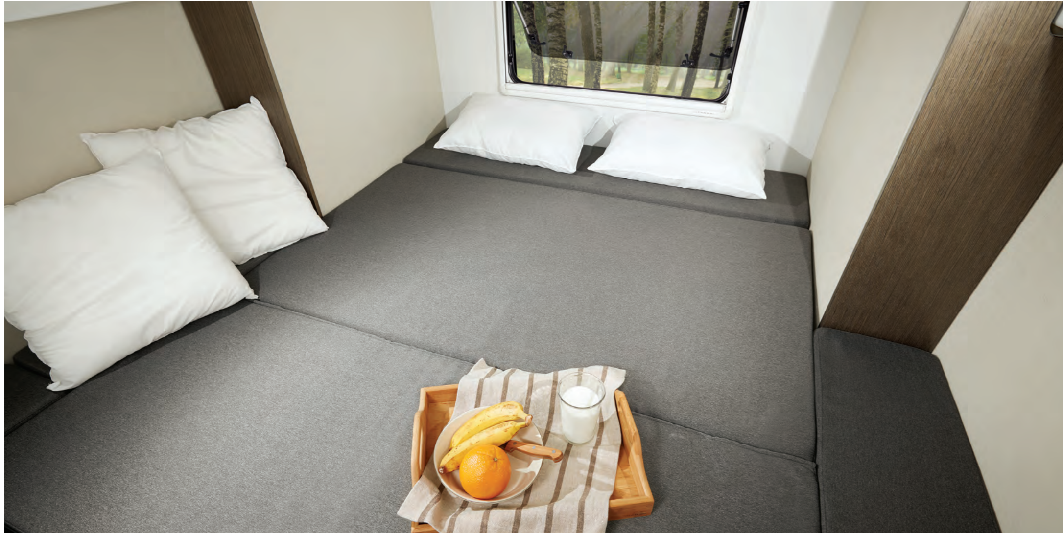
스마트 룸 (디럭스) 전동식 확장형 공간으로 캠핑시에는 넓은 다용도 공간으로 활용 할 수 있고 취침시에는 넓고 안락한 침실 공간이 확보됩니다.