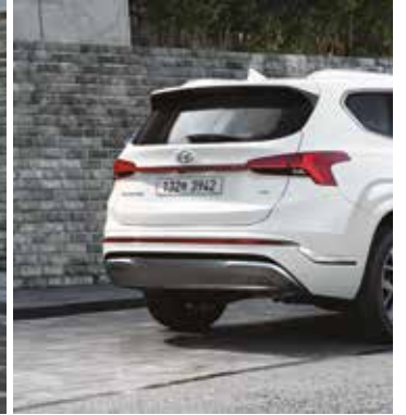
LED 리어 콤비램프 및 크롬 스킵드 플레이트