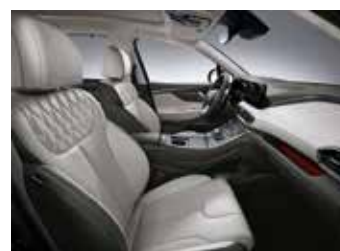
라이트 그레이 나파가죽 시트