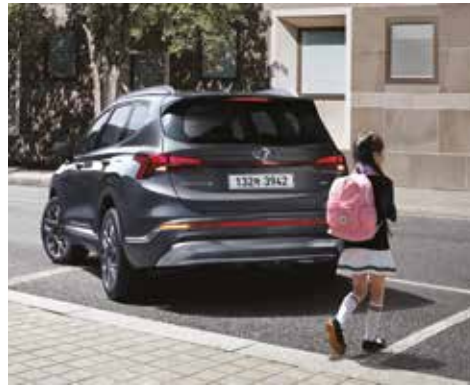
후방 주차 충돌방지 보조