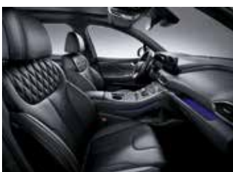
블랙 모노톤 나파가죽 시트