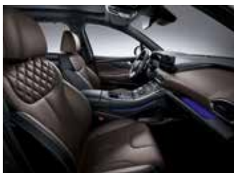
브라운 가죽 시트