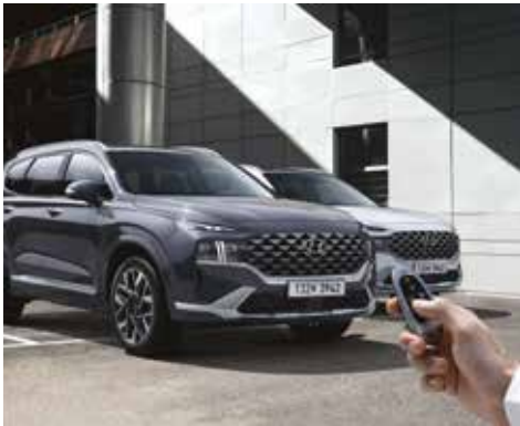
원격 스마트 주차 보조