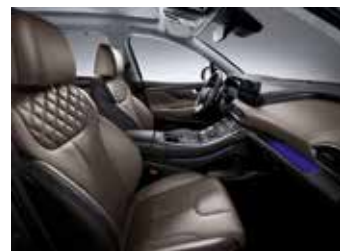
다크 베이지 가죽 시트