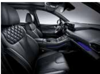
블랙 모노톤 가죽 시트