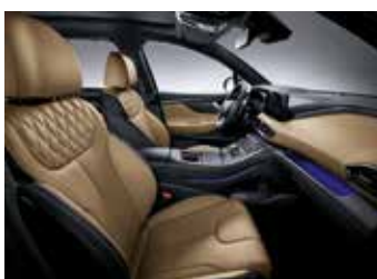
카멜 나파가죽 시트