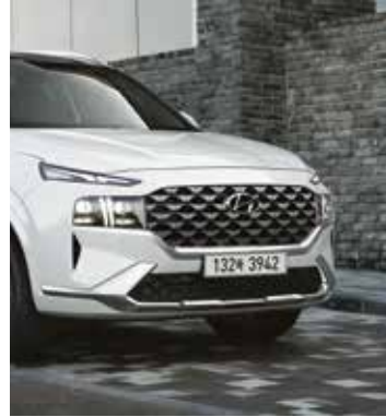
크롬 라디에이터 그릴 및 스킵드 플레이트