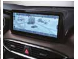
클러스터(12.3인치 컬러 LCD) 10.25인치 내비게이션