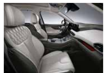
라이트 그레이 나파가죽 시트