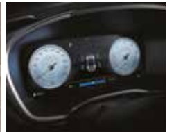
클러스터(12.3인치 컬러 LCD) 10.25인치 내비게이션