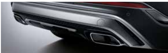
※ 듀얼 머플러 & 리어 스키드는 디젤 2.2 차량에만 선택 가능합니다.