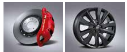
모노블록 4P 캘리퍼, 하이브리드 디스크, 로우 스틱 패드