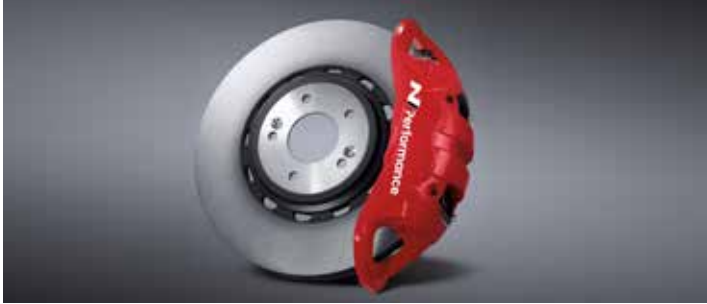
모노블록 4P 캘리퍼 & 하이브리드 디스크 & 로우 스틸 패드