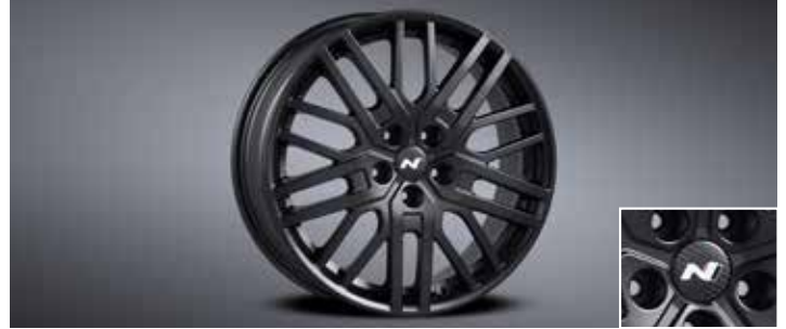
19인치 블랙 경량 휠 & 리얼 카본 휠캡