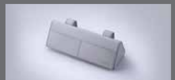
선바이저 선글라스 케이스