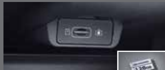
빌트인 캠 2 전용 마이크로SD 카드(128GB)