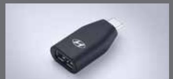
C to USB-A 변환 젠더

※ 위 H Genuine Accessories는 쏘나타 N Line 차량에도 적용 가능합니다. ※ LED 라이팅 플러스 패키지의 도어스윙 램프는 1열에만 적용됩니다. ※ C to USB-A 변환 젠더는 현대자동차 전용 개발 제품으로 타 제품 및 타 자동차 브랜드에서는 작동을 보장하지 않습니다. ※ H Genuine Accessories 신차 옵션 상품 선택 시 납량, 철국, 영남 출고센터에서만 출고가 가능합니다. ※ 위 상품은 트림 및 옵션 선택에 따라 적용 가능 여부가 달라질 수 있습니다. 자세한 사항은 해당 딜의 가격표를 참고해 주시기 바랍니다. ※ H Genuine Accessories 신차 옵션 상품 선택 시 기존에 장착된 부품의 처리 비용은 해당 패키지 판매가격에 반영되어 있어 별도의 보상은 없습니다.