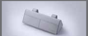
선바이저 선글라스 키스