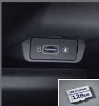
빌트인 캠 2 전용 마이크로SD 카드(128GB)