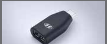
C to USB-A 변환 젠더