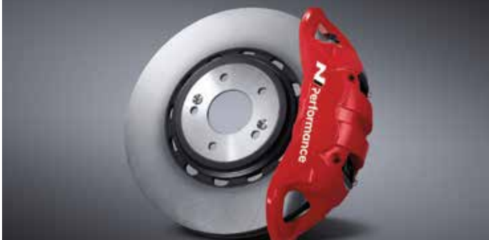
모노블록 4P 캘리퍼 & 하이브리드 디스크 & 로우 스틸 패드