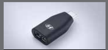
C to USB-A 변환 젠더

※ 위 H Genuine Accessories는 쏘나타 N Line 차량에도 적용 가능합니다. ※ LED 라이팅 플러스 패키지의 도어스윙 램프는 1열에만 적용됩니다. ※ C to USB-A 변환 젠더는 현대자동차 전용 개발 제품으로 타 제품 및 타 자동차 브랜드에서는 작동을 보장하지 않습니다. ※ H Genuine Accessories 신차 옵션 상품 선택 시 납량, 철국, 영남 출고센터에서만 출고가 가능합니다. ※ 위 상품은 트림 및 옵션 선택에 따라 적용 가능 여부가 달라질 수 있습니다. 자세한 사항은 해당 월의 가격표를 참고해 주시기 바랍니다. ※ H Genuine Accessories 신차 옵션 상품 선택 시 기존에 장착된 부품의 처리 비용은 해당 패키지 판매가격에 반영되어 있어 별도의 보상은 없습니다.