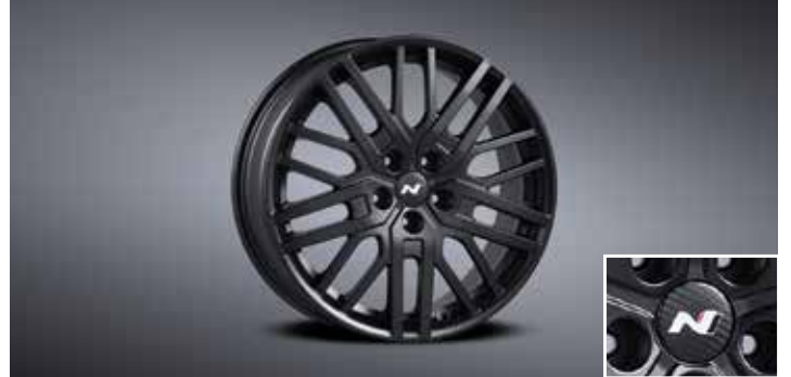
19인치 블랙 경량 휠 & 리얼 카본 휠캡