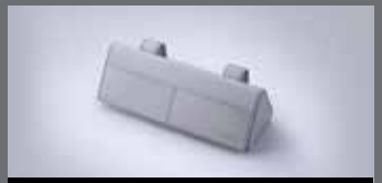
선바이저 선글라스 케이스