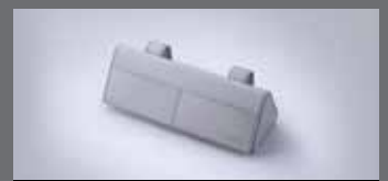
선바이저 선글라스 케이스