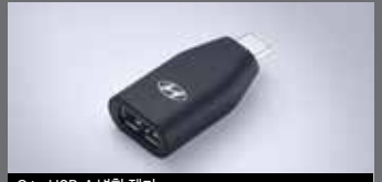
C to USB-A 변환 젠더