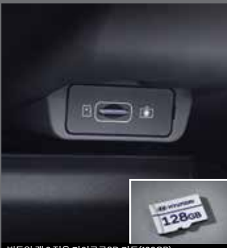
빌트인 캠 2 전용 마이크로SD 카드(128GB)