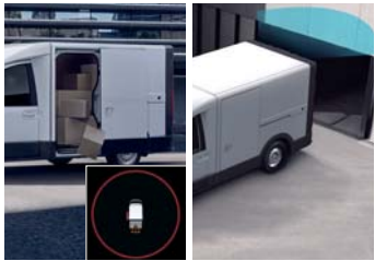
카고 안전 시스템(카고 도어 열림 주행 경고, 카고 후방 충돌 경고)