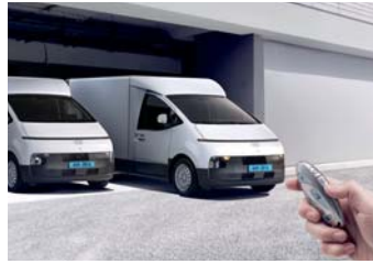
원격 스마트 주차 보조