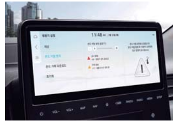
카고 온도 이탈 경고