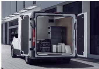
리어 트윈 스윙 도어(마그넷 도어 체커, 전동식 락킹 시스템 포함)