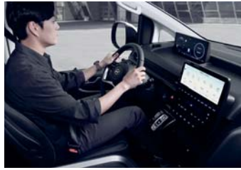
스마트 드라이브 레디