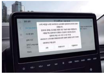
무선 소프트웨어 업데이트 (OTA Software Update)