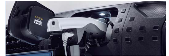
[애프터마켓 전용 상품] 실외 V2L 커넥터