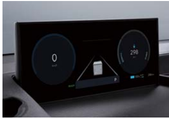
클러스터(12.3인치 컬러 LCD, 디지털)