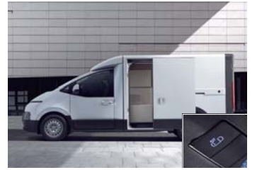
파워 슬라이딩 도어