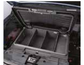
포터블 프렁크 정리함