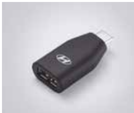
C to USB-A 변환 젠더