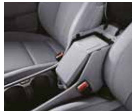
포터블 콘솔 정리함