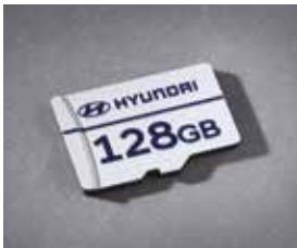
빌트인 캠 2 전용 마이크로SD 카드 (128GB)