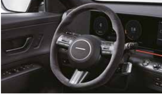
알칸타라 스티어링 휠