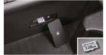
빌트인 캠 2 전용 마이크로SD 카드(128GB)