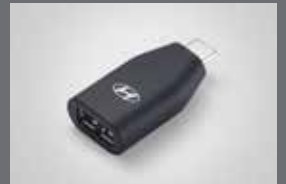
C to USB-A 변환 젠더