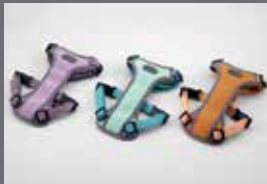
하네스 II (일상생활용, 소형/중형)