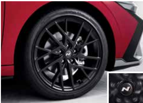
18인치 스포츠 디자인 휠 & N로고 스피닝 휠캡