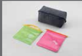
멀티파우치 & 포터블 포켓(먹이용/세면용)

※ C to USB-A 변환 젠더는 현대자동차 전용 개발 제품으로 타 제품 및 타 자동차 브랜드에서는 작동을 보장하지 않습니다.