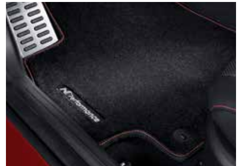
N로고 플로어 매트(1열, 2열)

※ 상기 N Performance parts 상품은 N Line차량에만 적용 가능합니다.