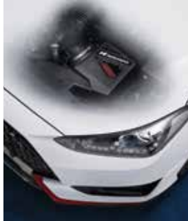
고성능 흡기 시스템