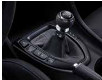
알칸타라 수동 변속기 노브 & 부츠 *DCT 적용 가능