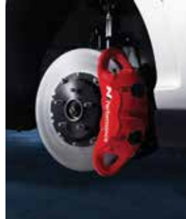
N 퍼포먼스 브레이크 시스템 (모노블록 4피스톤 캘리퍼, 볼팅타입 하이브리드 디스크, 로우 스틸패드)