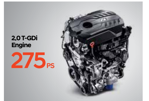
N 전용 2.0T-GDi Engine(퍼포먼스 패키지 미적용 시 250PS)