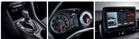
N DCT 기어노브 & 부츠