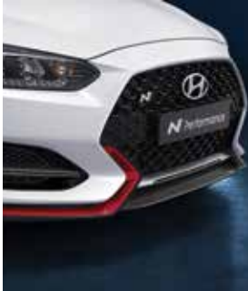
카본 프론트립 & 포그 가니쉬