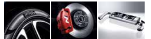
피렐리 P Zero 썸머타이어