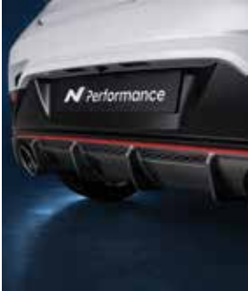
카본 리어 디퓨저