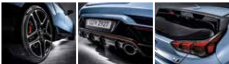
19인치 알로이 휠 & 사이드 실