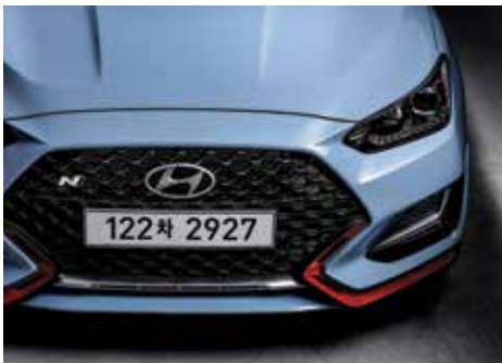
와이드 타입 라디에이터 그릴 & 에어커튼