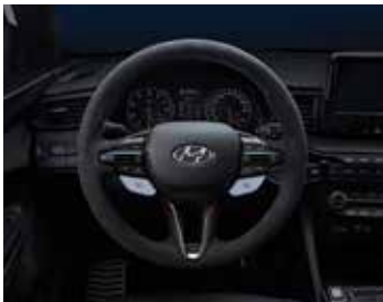
알칸타라 스티어링 휠