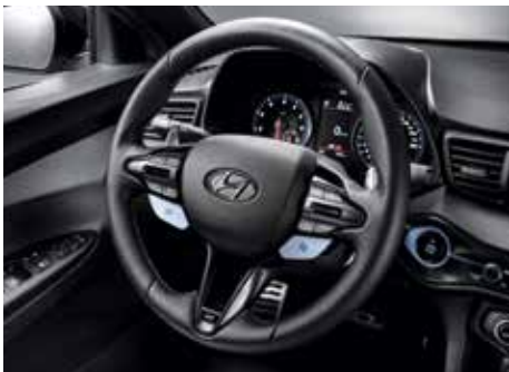
스포츠 스티어링 휠 & 패들 슈프트