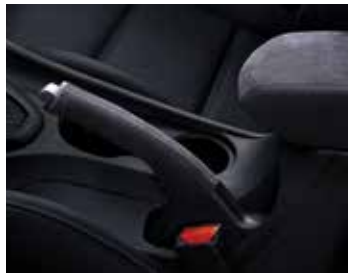
알칸타라 파킹레버 & 센터콘솔