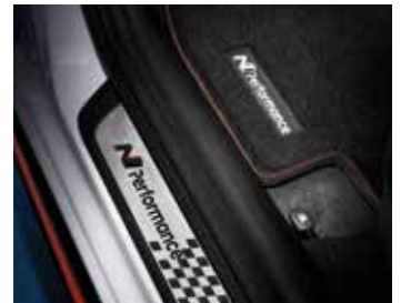
N 퍼포먼스 전용 매트 & 메탈 도어스커프